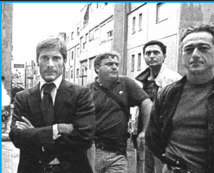
Státní zástupce Giovanni Corona se svými spolupracovníky v Neapoli

odvoz odpadu a peníze vydírané za „ochranu“ jsou – v tomto pořadí – sloupy miliardového podnikání. Tak třeba jen ve čtvrti Secondigliano je kolem 20 míst, na nichž se obchoduje s drogami a na nichž téměř 500 pushrů má denně obrát 800 až 1000 eur. To dohromady představuje půl milionu eur. A nejméně totéž množství drog jde denně filiálkám do střední a severní Itálie. Vysoce výdělečné – a jen s malým rizikem – jsou i výroba a obchod s padělaným značkovým zbožím. Kolem Vesuvu