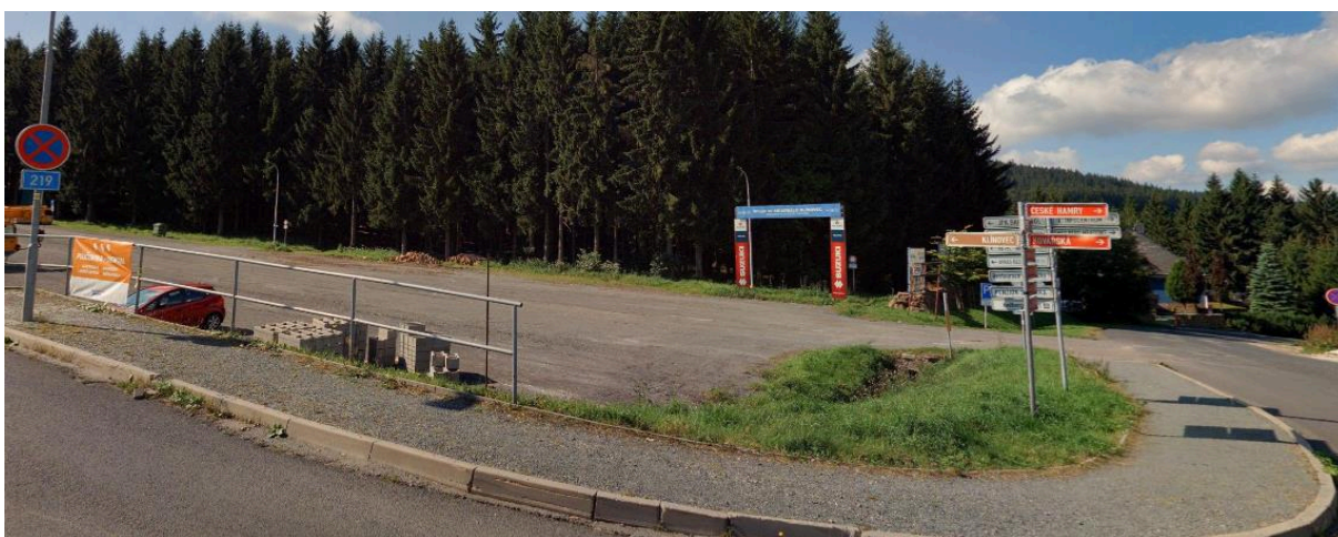
Obr. č. 6: pohled na pozemek p.č. 590/2 ze severní strany (a)