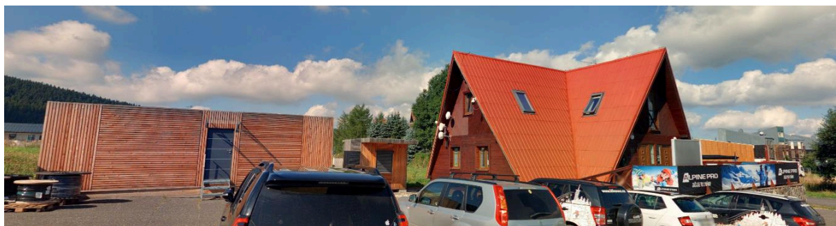
Obr. č. 1: celková situace