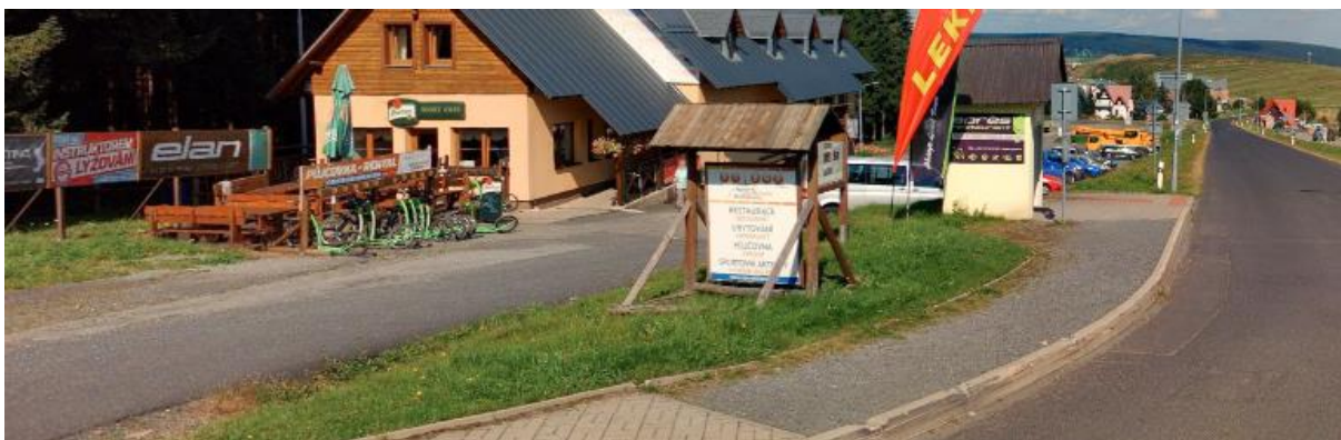
Obr. č. 10: pohled na pozemek p.č. 608 (zelený lem mezi komunikací vpravo a p.č. 607 vlevo)