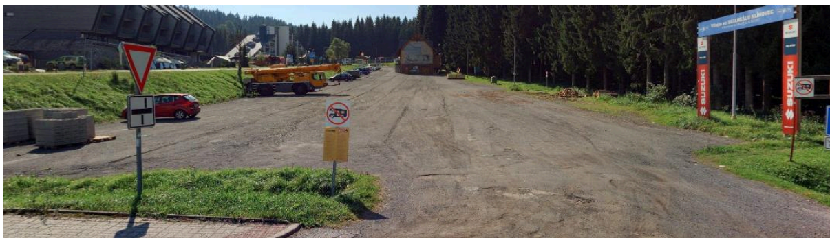
Obr. č. 7: pohled na pozemek p.č. 590/2 ze severní strany (b), úzký lem zpevněné plochy vpravo je p.č. 590/3