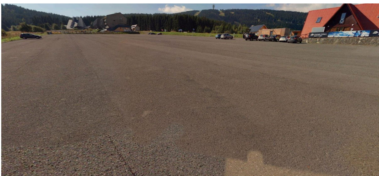
Obr. č. 4 a 5: pohledy na pozemek p.č. 1172/5 z jižní a severní strany