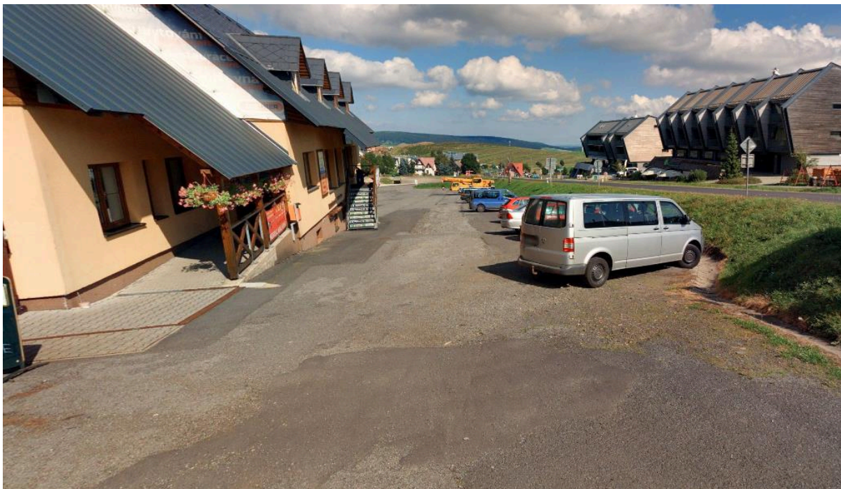
Obr. č. 8: pohled na pozemek p.č. 607 z jižní strany (vlevo stp. 292 se stavbou v majetku Active Klínovec s.r.o.)