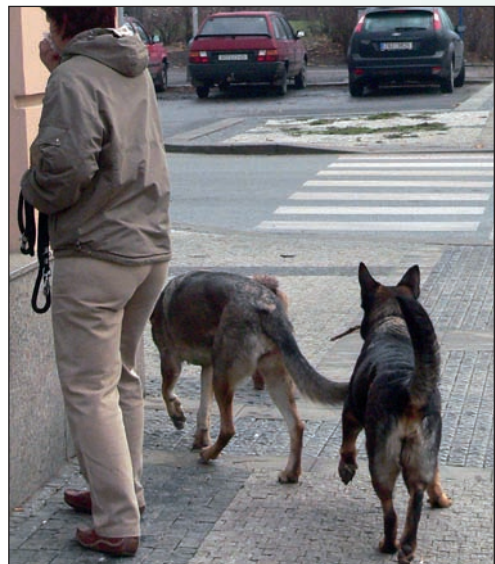
Psi v pražských parcích – věčný zdroj sporů, který nezřídka musí řešit i policie

Denní chléb policistů z místních oddělení, to jsou drobné trestné činy a přestupky, jež ovšem lidem z okolí proklátě otravují život. Karlín, jen co by dohodil kamenem z městského centra, je rušná čtvrť a náramně vábí zejména kapsáře: šikovní zloději operují v partách a jejich dlouhé prsty řadí zejména v tlačenicích kolem zmíněného už autobusového nádraží, ale právě tak v obchodech, metru a tramvajích. Díky nim jsou zloději ovšem taky velice mobilní, jejich zásada je udělat „ranku“, probrat pár kapes, vybrat