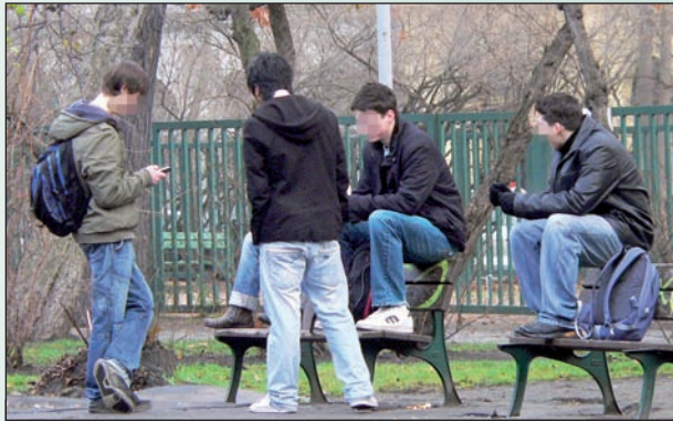
Karlínské mládež: sedět na lavičkách normálně? A proč?