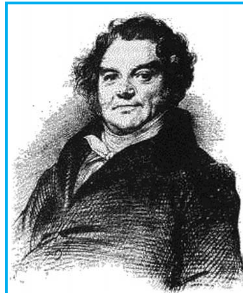
Eugène François Vidocq

nebo například o vědecké zkoumání zbraní... O jeho charakteru se říkalo leccos. Pravda je, že za léta svého působení ve státní službě (1811–1827) znásobil svůj majetek v míře mnohokrát převyšující jeho oficiální příjmy včetně prémie vypsány za dopadení některých pachatelů. Jako majitel moderní detektivní agentury pak od roku 1833 chránil pařížské podnikatele proti zlodějům a podvodníkům. Úřadům se stal trnem v oku, protože to považovaly za útok na své výsadní postavení, resp. mocenský monopol – a tento postoj k soukromým bezpečnostním službám přežívá leckde v Evropě dodnes. Vidocq nakonec