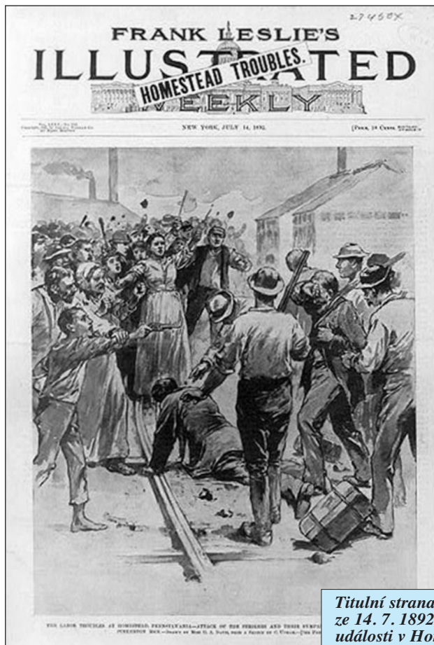
Titulní strana newyorských novin ze 14. 7. 1892 zobrazuje krvavé události v Homesteadu

Nejeden sci-fi román přináší vizi, kdy Země, země nebo regionu vládne jakýsi soukromý koncern (koncerny), uplatňující svou neomezenou moc prostřednictvím vlastní nebo najaté soukromé policie, respektive bezpečnostní agentury. Tak daleko to zatím ještě nikde nedošlo, ale například v současném Iráku už představují soukromé (zahraniční) bezpečnostní služby druhou nejpočetnější ozbrojenou složku hned po vojenských jednotkách USA – a je to americká vláda, která je platí. Jejich zaměstnancům se moderně říká kontraktori. Podívejme se ale, jak to všechno začalo.