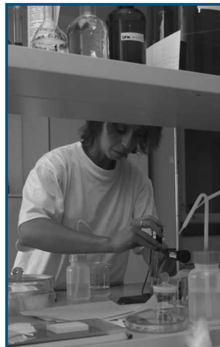
Servis laboratoří využívají nejen „domácí“ restaurátoři a konzervátoři – vysoce erudované zázemí pomáhá i dalším archivům

vybraný fond k „ozdravení“, jaká je jeho cesta?