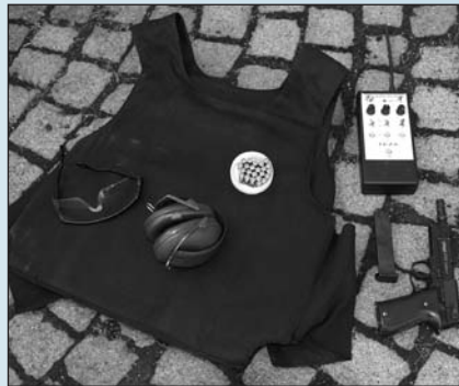
Vybavička pro výcvik střelce

Honičky na letištní ploše se odehrávají v dosti živém tempu, maximálně ovšem do rychlosti osmdesát kilometrů v hodině. Ono se to nezdá, ale je to už hodně ostrá jízda.