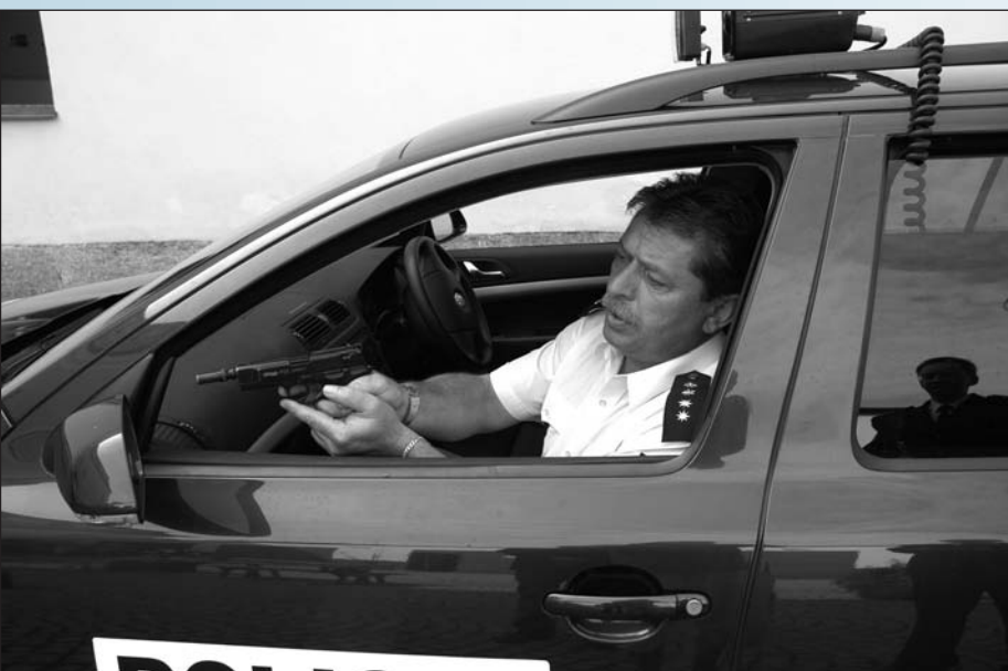
Tak takhle ne!