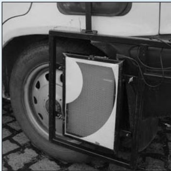
Elektronický terč na levém zadním kole škodovky

Zatím byla pořád řeč jen o jednom: o střelbě z jedoucího auta na jedoucí vůz. Ale neméně obtížné je i pro dobrého střelce zasáhnout uhánějící vůz z místa! Musí přesně odhadnout rychlost a střilet vlastně před něj... Pro nácvik takových situací má pojízdný trenážer snímače zásahů i na chla-