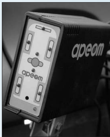
Černá skříňka je srdcem trenážeru

diči a z boku u předních kol. Zpředu jsou za jízdy přední pneumatiky reálně nezasáhnutelné.