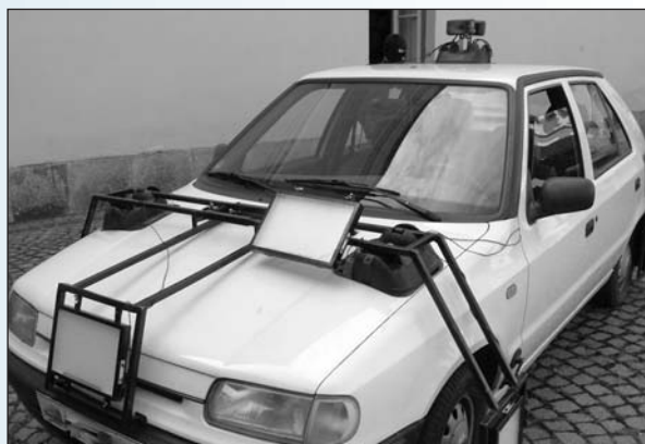
Felicie, jež se stala střeleckým trenážerem, v plné kráse

namontovány elektronické snímáče, jež zaregistrují zásahy laserem, namontovaným na zcela běžné služební devítce, kompaktu.