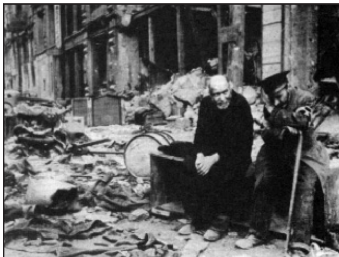
Po dvanácti letech vlády hitlerovců však zůstaly z Německa jen trosky