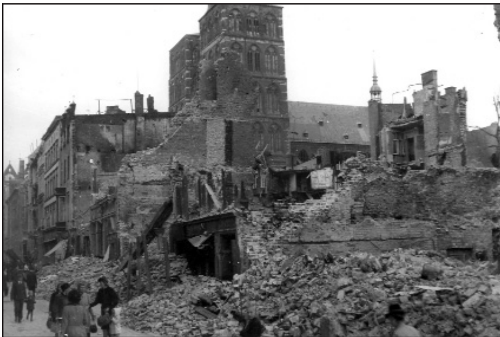
Ze „světovládých snů“ zůstaly jen rozvaliny...

Říšský vůdce SS si našel čas k odpovědi až 7. února 1945. „Váš statečný a velmi pochopitelný dopis... mne upřímně potěšil,“ napsal. „Zde na Východě mám sám co dělat. Ale pevně věřím, že se nám podaří nejdříve zastavit postup Rusů a pak zpět dobýt ztracené území. Jakkoli to v tomto okamžiku zní snad nepravděpodobně, my prostě nemůžeme být poraženi, nýbrž vyjdeme z tohoto roku, který je vyvrcholením našeho boje, vítězně.“