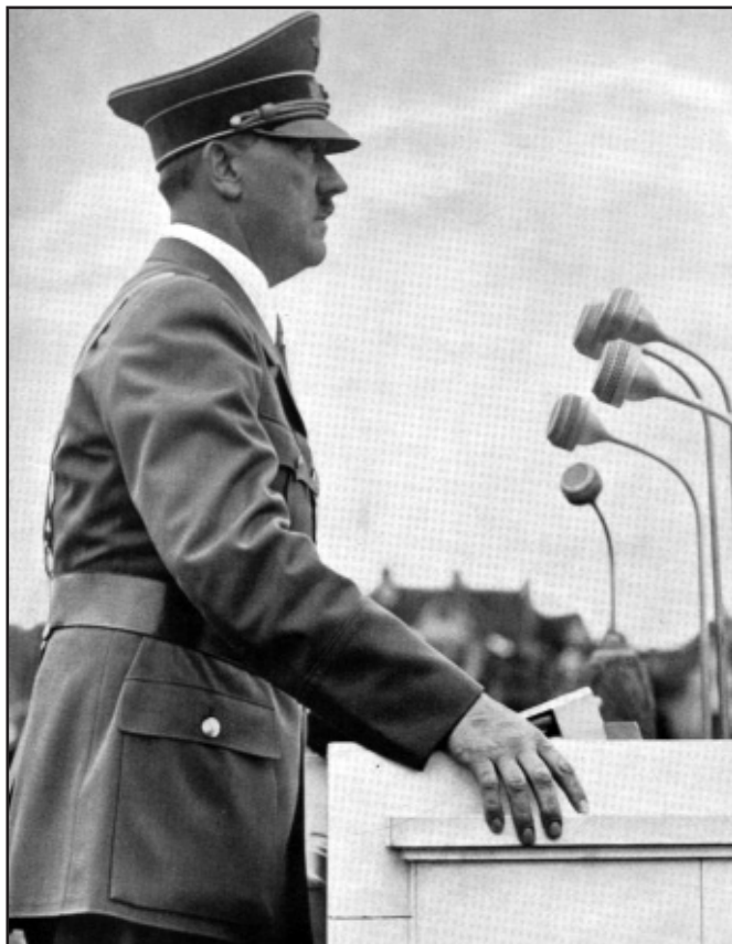
Adolf Hitler sliboval Němcům, že jejich země se stane pánem světa

Skvělý čin, řečeno slovy Winstona Churchilla, započal před úsvitem 12. ledna na Visle, pokračoval 14. ledna ve Východním Prusku a během nejbližších dnů se ofenziva drtivým způ-