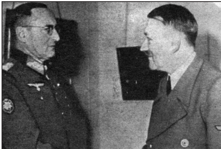
Adolf Hitler a maršál Ferdinand Schörner. Dva muži, kteří v závěru války značně ovlivnili dění na území tehdejšího protektorátu