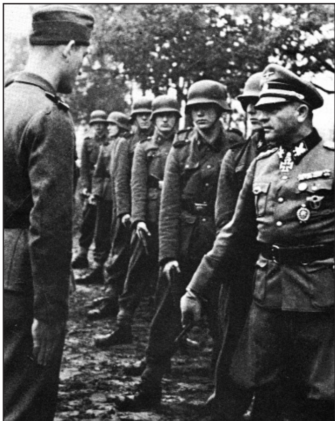
Vysoký důstojník SS Josef „Sepp“ Dietrich, koncem roku 1944 velitel 6. tankové armády v rámci Waffen-SS, při osobním výcviku svých podřízených