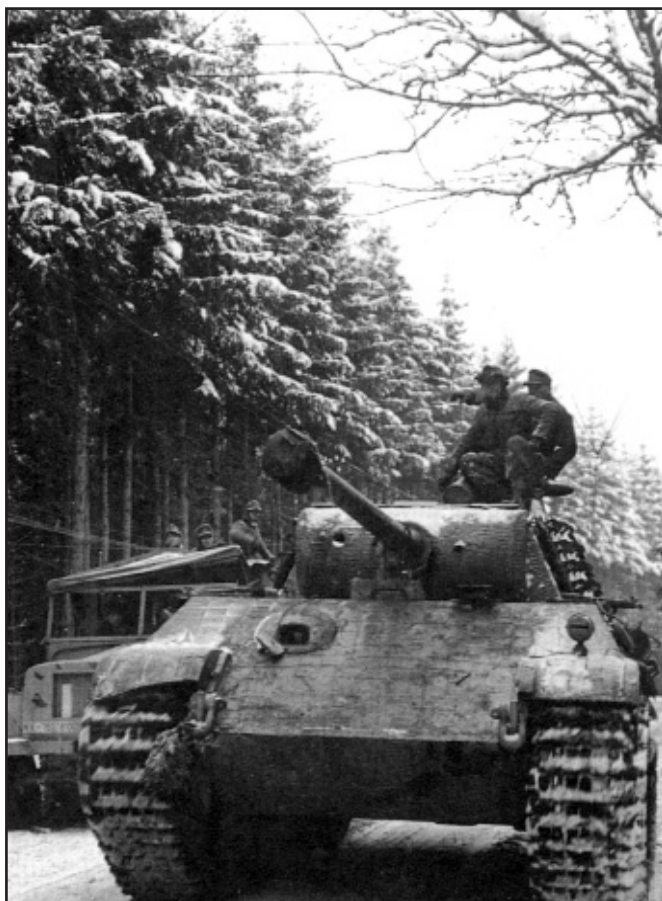
Němci použili v Ardenách nejnovější zbrojní techniku. Na snímku z přelomu prosince 1944 a ledna 1945 je při horském přesunu zachycen tank Panzer V Panther, model G

a najednou projížděla kolem nějaká německá jednotka. Její velitel přikázal svým mužům, aby všechny Američany potříleli. A oni to udělali. Nemohlo to být pro ty, co umírali, žádné překvapení, stejně jako by to nebylo překvapení pro nás. Byli jsme úplně na dně a smrt nás nemohla zaskočit... Nastrkali nás do nákladních vlaků, kterými přivezli na frontu většinu svých vojáků. Byla to stejná cesta, jako kdyby nás vezli do Osvětimi. Dobyččáky naplněné až k prasknutí, bez jídla a vody. Nikdy bych nevěřil, jaká spousta vojáků se může napěchovat do těch zatracených vagonů. Při spaní jsme se museli střídat: jedni stáli, druhí leželi. V noci byl náš vlak napaden letadly, zasažena byla spousta vagonů. Všichni důstojníci z naší roty byli zabiti, protože měli smůlu v tom, že se vezli ve voze, který byl zcela zničen.“