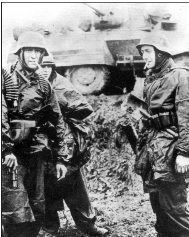
Poteau v Belgii, 18. prosinec 1944. Dva granátníci z 1. tankové divize SS si pochutnávají na ukořistěných cigaretách poté, co zničili americký obrněný vůz

„Ano. Nikdy po válce jsem se na mapu nedíval, ale řekl bych, že ve chvíli, kdy nás zajali, jsme se nacházeli asi padesát kilometrů za frontou. Němci postupovali velmi rychle. Nakonec jsem se ocitl asi s dvaceti lidmi v malé úzlabince.