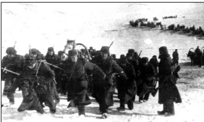
Boje v zimním terénu byly nesmírně těžké. Poznali to na vlastní kůži i naši vojáci v rámci Svobodova armádního sboru

A také musel své čím dál víc prvořadě zájmy o budoucnost - aby se nevystavoval přímému nebezpečí - vhodně skloubit