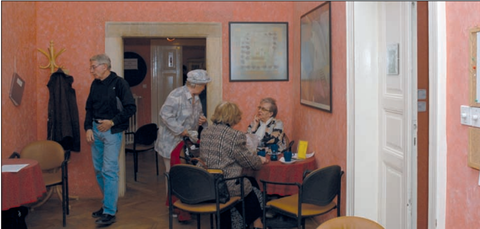
Dámy si rády posedí v kavárně...