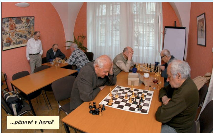
...pánové v herně