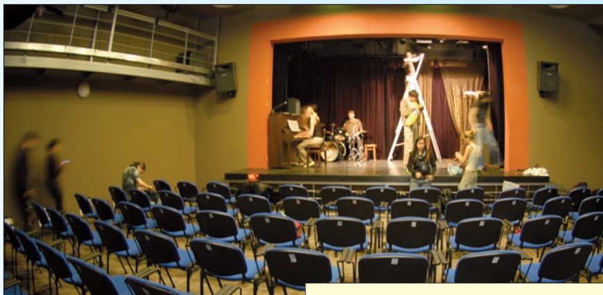
Zatím se v divadle zkouší. Večer bude nabito.