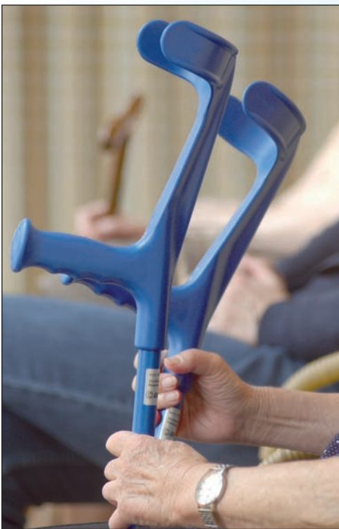
Pády patří k rizikům vyššího věku

nechala umluvit. S dvojicí prakticky cizích lidí šla vyzvednout celou svoji hotovost, potom ji podvodníci taxikem odvezli před neznámý dům s jakousi mosaznou cedulkou u vchodu. Špatný zrak nedovolil přecházt, co je tam vlastně napsáno, prý jsou příslušné bankovní kanceláře ve třetím patře. Ale bez výtahu.