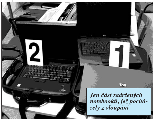
Jen část zadržených notebooků, jež pocházely z vloupání

Parták z Říčana pracoval v tamním autobazaru, kriminálka si přišla pro něj do práce. A zatýkáni ovšem přivábilo velkou pozornost: několik desítek diváků z okolí, ženy omdlévaly, děcka vřískala. Paráda, hotová Sicílie!