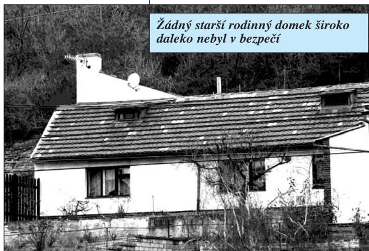
Žádný starší rodinný domek široko daleko nebyl v bezpečí