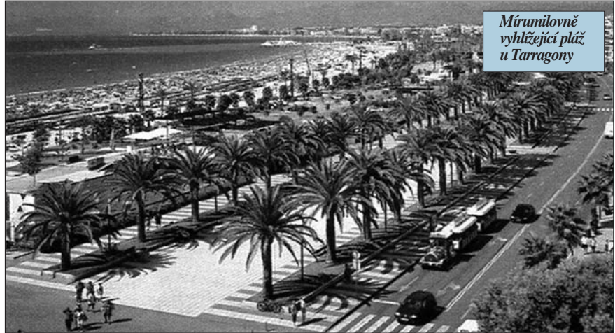
Mírumilovně vyhlázející pláž u Tarragony

Početné bandy z východní Evropy se letos v létě opět vyořily na středozemním pobřeží Španělska a na zámožných předměstích větších měst. Se zbraní v ruce nutí své oběti prozradit čísla kreditních karet a kódů jejich sejfů a samozřejmě vyprázdnit i peněženky či kabelky. A protože dosud takové násilí a v takovém množství nepoužívaly, zámožná sídliště jsou v panice. Jak píše španělský tisk, například v okolí katalánského přístavu Tarragona zažívali v posledních týdnech brutální raubířské přepady a dokonce i únosy. Pachatelé, údajně převážně bývalí policisté z Rumunska, Bulharska, Kosova nebo z bývalého Sovětského svazu, se snaží obohatit v co nejkratším čase, a tudíž razantně. Opozice obvi-