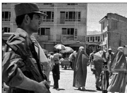
Policista v Kábulu

policejním šéfem „drogové“ provincie Bada-chšán a jeho jméno je podle informací NATO spojováno se zneužíváním úřední moci a kri-