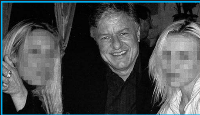
Takhle se rekreaovalo na útraty VW

lečnice. Sekretářka odnesla obálku a vrátila se s požadovaným obnosem.