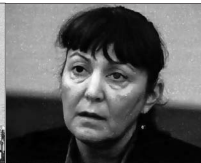
Monica Macoveiová (47) je právníčka a známá ochránkyně lidských práv, bez stranické příslušnosti

Evropská komise upozornila Rumunsko, že do standardů EU do očekávaného přijetí v roce 2007 – pokud jde o boj s korupcí a organizovaným zločinem – musí ještě hodně přidat. Rumunská ministryně spravedlnosti Monica Macoveiová má při tom plné ruce práce: kvůli korupci a zneužití úřední moci pracuje dnes 120 státních zástupců na 850 korupčních případech na nejvyšší politické úrovni a počet kauz dále roste. Výšetřován je i bývalý ministerský předseda (socialistická strana) kvůli pochybné koupi jednoho pozemku.