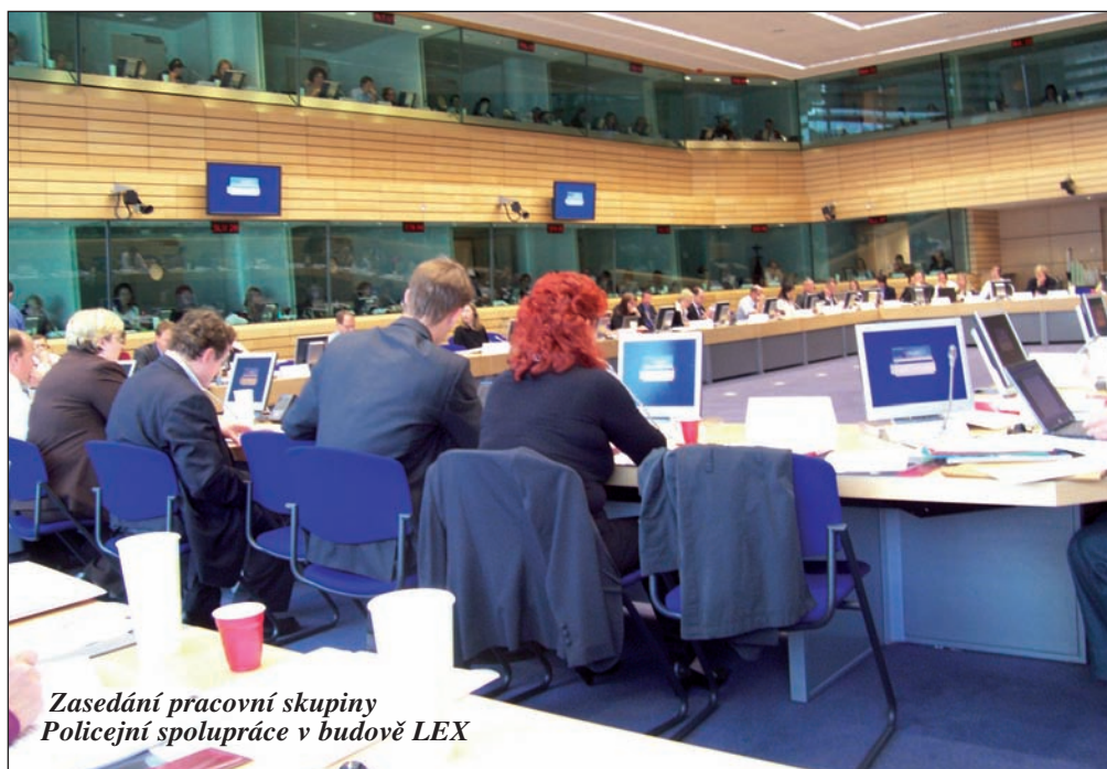
Zasedání pracovní skupiny Policejní spolupráce v budově LEX

Tento informační systém slouží zejména pro pátrání po osobách (hledaných,