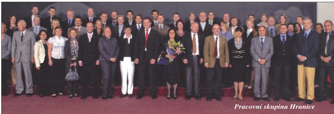
Pracovní skupina Hranice

pohřešovaných, nežádoucích) a věcech (vozidla, registrační značky, cestovní a osobní doklady, registrační doklady k vozidlům, bankovky a zbraně).