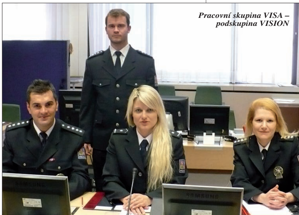
Pracovní skupina VISA – podskupina VISION

Tato skupina se zabývá problematikou výměny informací v EU. V rámci českého předsednictví se její aktivity zaměřily především na aktuální potřeby spojené s implementací tzv. Průmských rozhodnutí (výměna otisků prstů, DNA, informací o vozidlech) a tzv. Švédského rámcového rozhodnutí (zjednodušení výměny operativních a jiných informací).