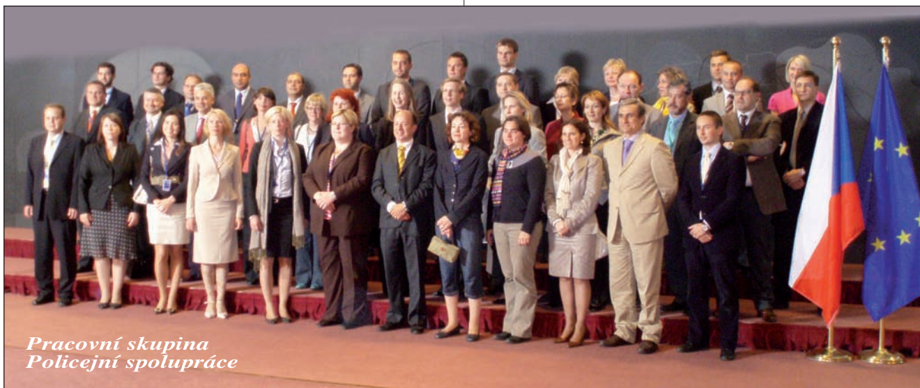
Pracovní skupina Policejní spolupráce

SIS a SIRENE jsou hlavními nástroji pro pátrání po pohřešovaných nebo unesených dětech i po jejich únoscích v schengenském prostoru. V ochraně dětí tak hrají klíčovou roli. Česká