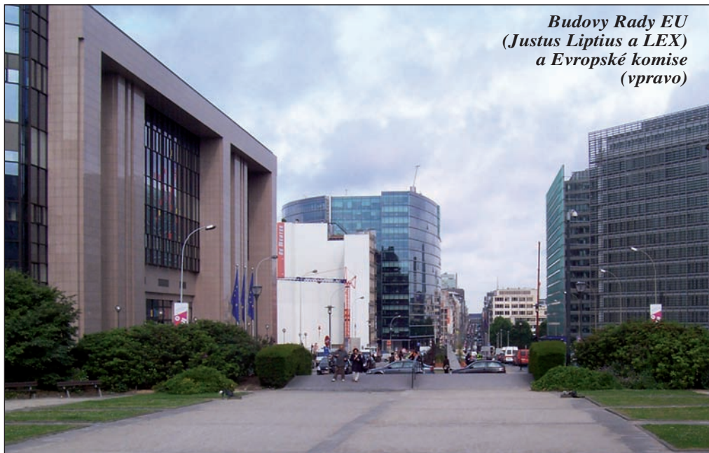
Budovy Rady EU (Justus Lipsius a LEX) a Evropské komise (vpravo)

Prioritním cílem mezinárodního setkání expertů na městské násilí byla výměna zkušeností na poli boje s městským násilím, zejména s extremismem a diváckým násilím, ale i legislativní rámec práva na shromaž-