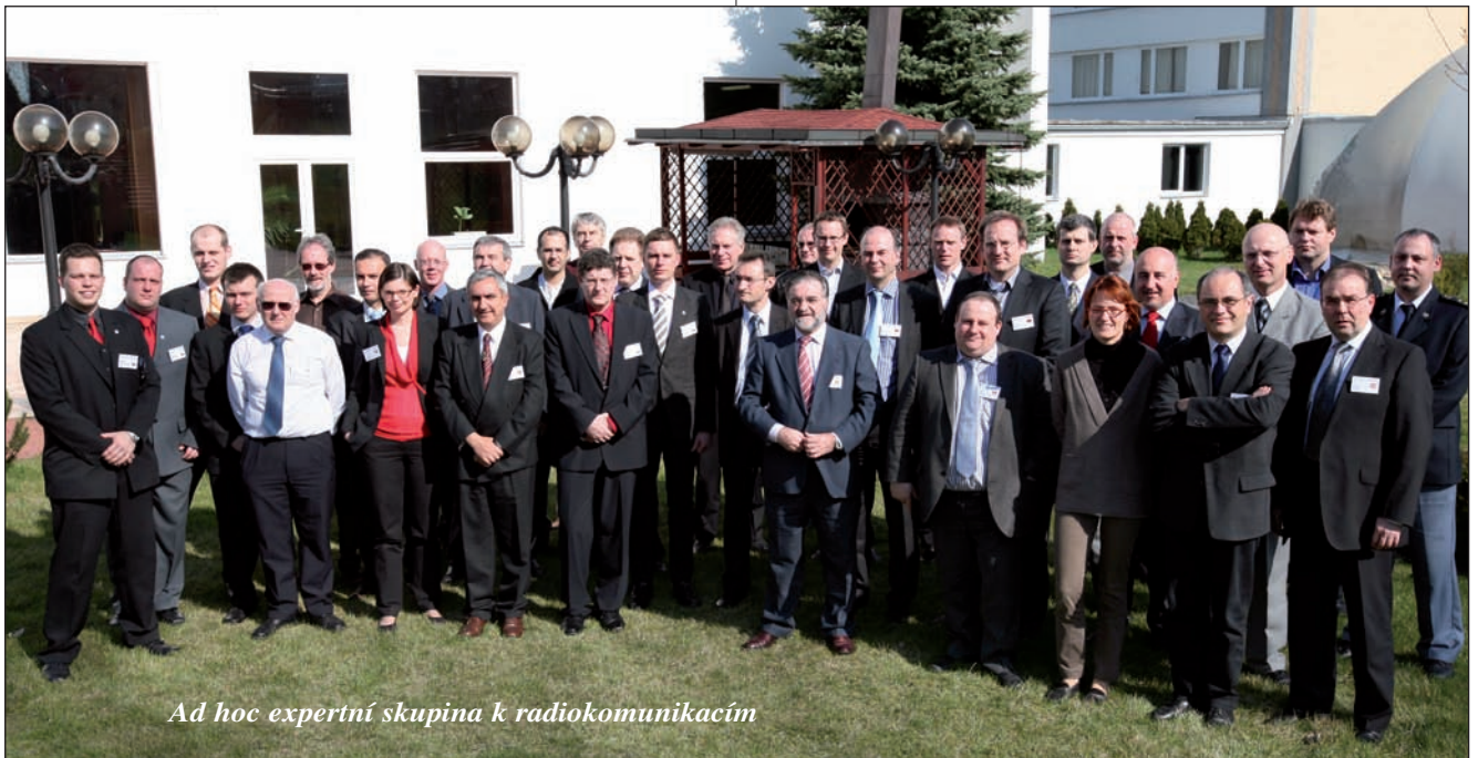
Ad hoc expertní skupina k radiokomunikacím