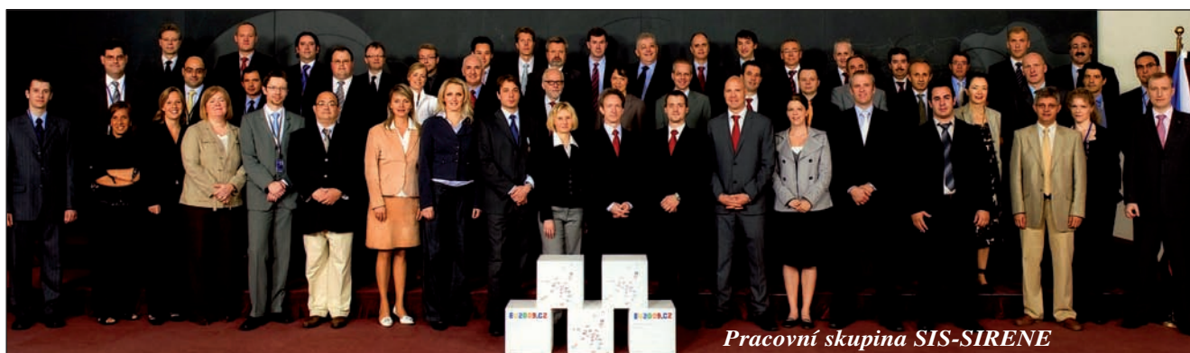
Pracovní skupina SIS-SIRENE

V souvislosti s implementací průmských rozhodnutí české předsednictví vypracovalo tabulku pro prohlášení členských států k maximální denní vyhledávací kapacitě u otisků prstů, tabulku k získání přehledu stavu implementace průmských rozhodnutí v jednotlivých členských státech.