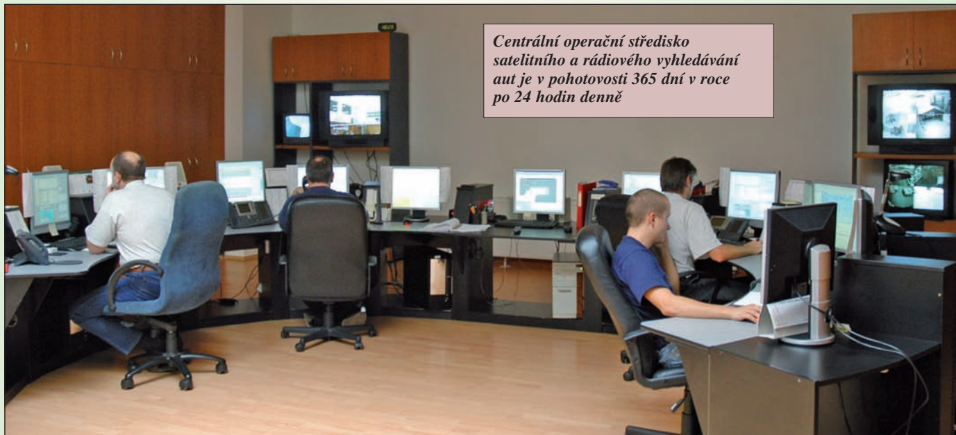
Centrální operační středisko satelitního a rádiového vyhledávání aut je v pohotovosti 365 dní v roce po 24 hodin denně