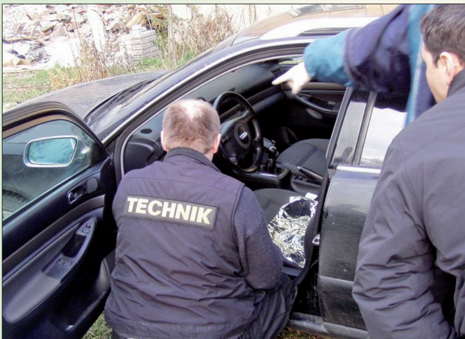
Technikům nezbyvá, než sečíst škody způsobené v interiéru vozidla