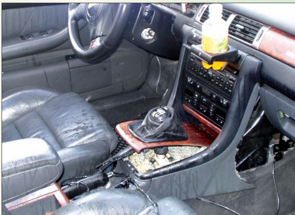
Při hledání ochranných čipů zloději auto většinou značně poničí

ných souvislostí taktéž a ve finále kriminálně odhalili zemědělskou usedlost, v níž vypulilo na denní světlo rozřezaných nakradených osobních aut za 37 milionů korun!