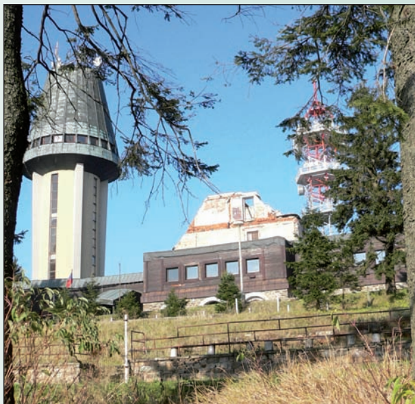
K turistickým zajímavostem obvodu (v dlouhé řádce) patří vyhlídková věž na Suchém vrchu (s vyhořelou chatou)...