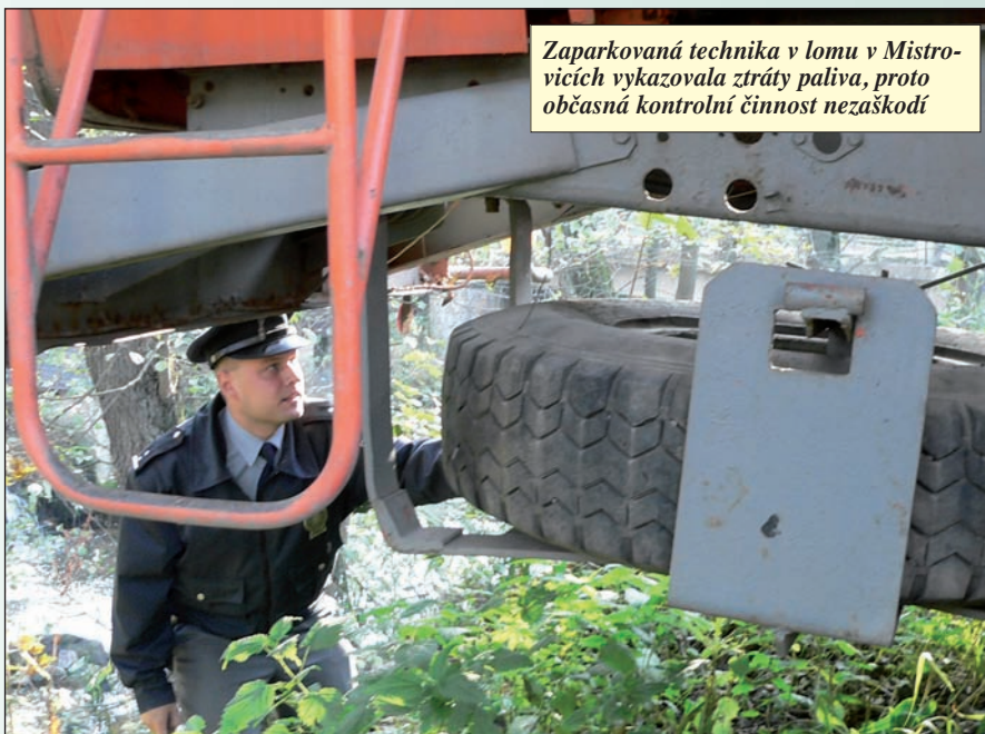
Zaparkovaná technika v lomu v Mistrovicích vykazovala ztráty paliva, proto občasná kontrolní činnost nezaškodí

Někdy před pěti lety měli obvodáci ve výčtu vážnějších případů i domácí zabíjačku.