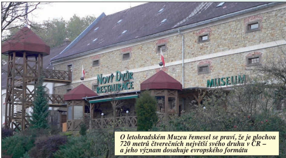
O letohradském Muzeu řemesel se praví, že je plochou 720 metrů čtverečních největší svého druhu v ČR – a jeho význam dosahuje evropského formátu