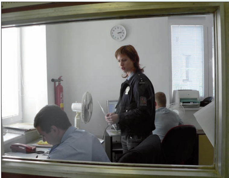
Živý obraz ze služební recepcy letohradských policistů