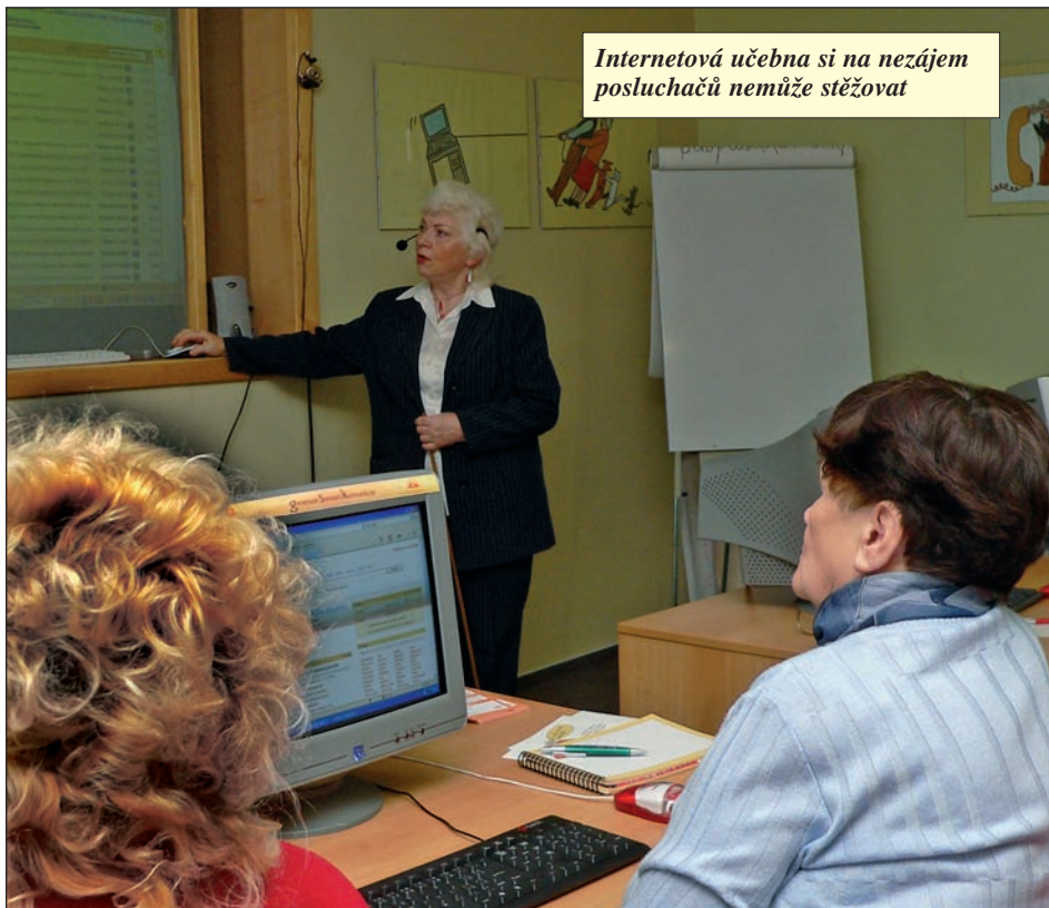
Internetová učebna si na nezám posluhačů nemůže stěžovat

Je ubližování hrubé, fyzické, ale existuje také teror psychický, který je možná nebezpečnější. Nesmyslná nařízení a drobné zákazy, do očí bijící bezohlednost. Bývalý majitel bytu si v nových podmínkách nesměl pustit ani rádio, ale byl nucen poslouchat bouřlivé večírky, které se táhly