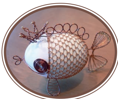
Ve výtvarné dílně se můžete naučit i nevšední umělecké techniky

Vážená Školičko, je tak úžasné, co pro nás starší ročníky, které se ještě z posledních sil snaží omládnout, děláte. Všechno mi jde tak pomalu, že až nyní vám posílám poděkování za perfektní kurz, který jsem u vás absolvovala. Hlavně se mi líbil přístup k našim ročníkům ze strany naprostých mladíků - instruktorů. To vlastní vnučata se tak krásně a hlavně trpělivě nechovají. Vůbec celá organizace kurzu působí velmi příjemně, a je to povzbuzení pro další snahu s počítačem pokračovat. Ohromně mi to