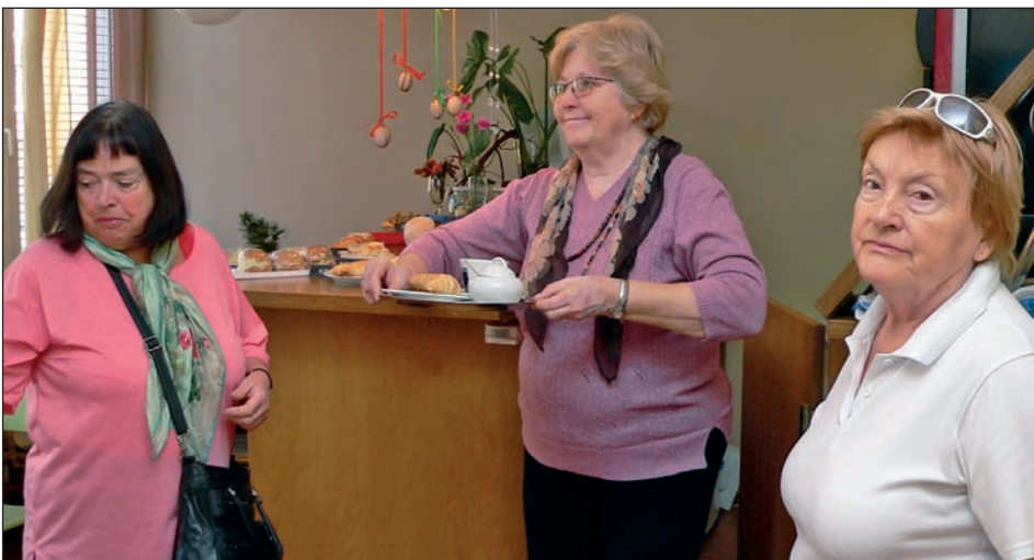
K vybavení Elpidy patří i malá kavárna

Je vlastně trochu paradoxní, že oč víc může internetová síť starším lidem přinést, o to je větší obava z nové a na pohled nesmírně složité moderní techniky. Na vině je možná samotný termín – počítač. Vyvo-