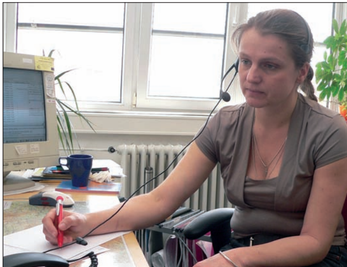
Operátoři Linky seniorů zůstávají anonymní