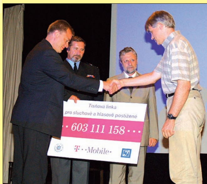
Zahájení provozu linky se zúčastnil i ministr vnitra František Bublan

Podobně by měla vypadat SMS zaslaná neslyšící osobou na linku tísňového volání (foto vlevo)