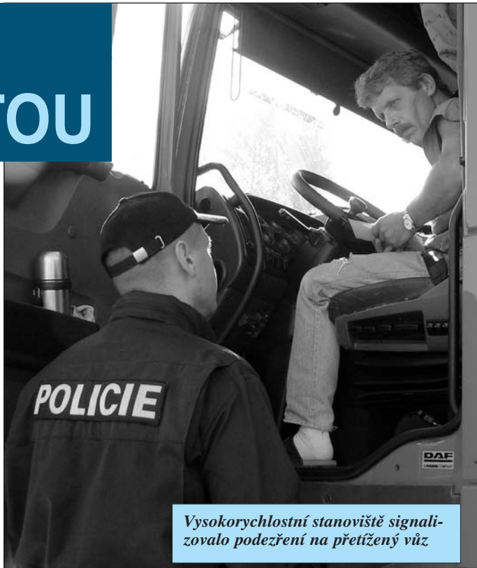
Vysokorychlostní stanoviště signalizovalo podezření na přetížený vůz

Stacionární váhy podobné té na Klíčově budou mít za úkol tento neutěšený stav poněkud omezit. A rozhodně ne bezdůvodně. Stačí jen zalistovat v novinách. Například dálnice D 1. Nehody kamionů zde patří k záležitostem téměř každodenním,