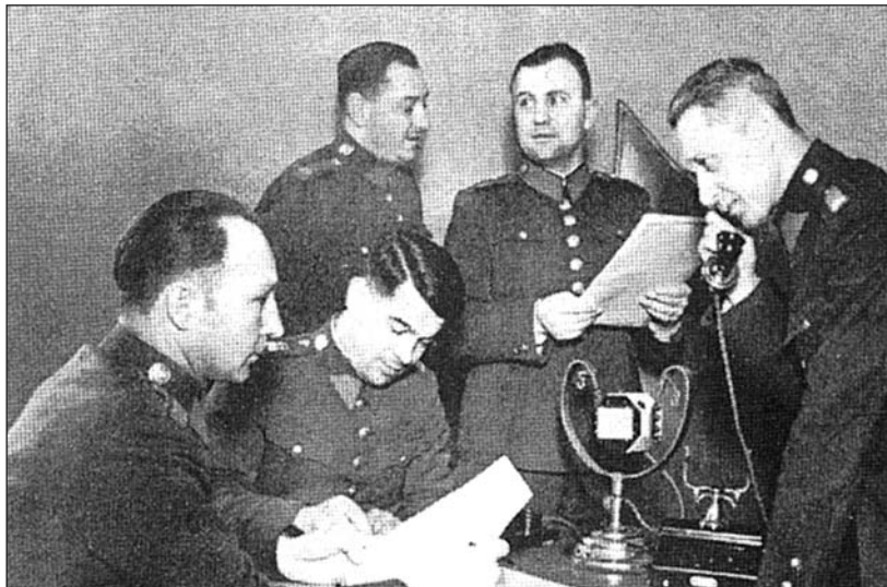
Ústřední četnické pátrací oddělení v Praze disponovalo od 30. let vysíláním bezpečnostního rozhlasu

cenných snímků, které se staly významným dokumentem o nacistickém barbarství.