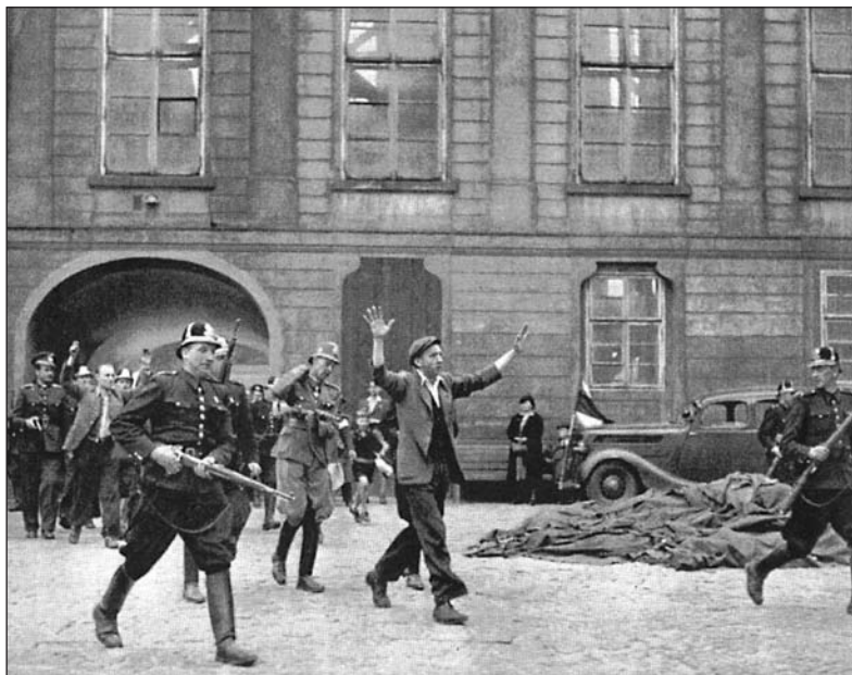
Policisté s četníky zajišťují 9. května 1945 poslední zákeřné střelce na pražském Hradě