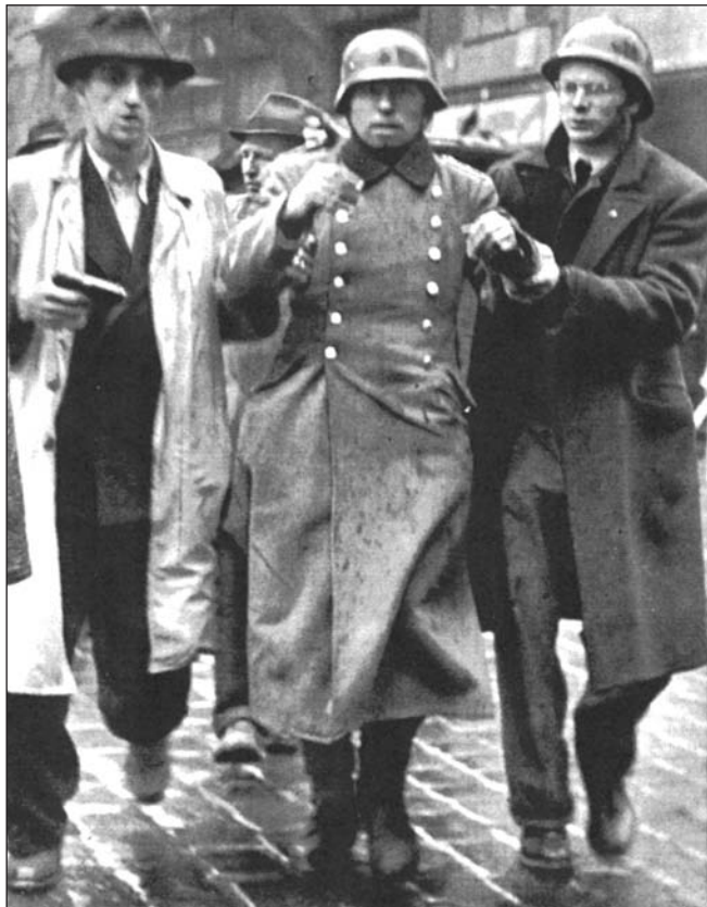
V sobotu 5. května 1945 povstali Pražané proti nacistickým okupantům...

Od 22. hod. Maďaři naše družstvo stále prudce ostřelovali. Snažili se zasazením pěších čet přímým útokem zmocnit se mostu, odkud by pak mohli rychleji postupovat údolím podél silnice a řeky k Perečtinu. Kanál nemohli Maďaři pro naši palbu a vysoký stav vody překročit. Palba Maďarů byla nepřesná, stříleli buď příliš vysoko nebo nízko a když se jim přece podařilo, aby nás palbou ohrožovali, změnili jsme svá stanoviště.