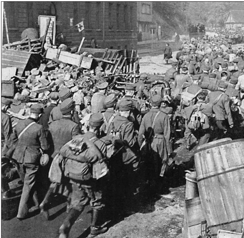
Ústup německých jednotek z povstalecké Prahy

Jde totiž o to, že koncem války se v Čechách objevily početné maďarské jednotky, které dosud bojovaly, podobně jako ruští vojáci generála Vlasova z Ruské osvobozené armády (ROA), po boku německé armády, a nyní by se rády od svého spojence trhly a vyhnuly se svou bojovou „rehabilitací“ závěrečné konfrontaci se sovětskými jednotkami.