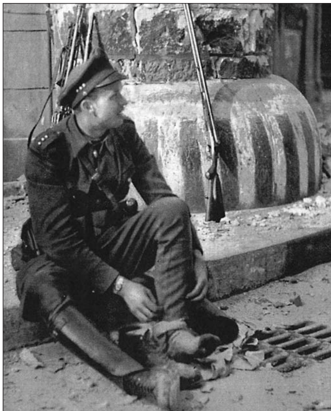
Četnický podstrážmistr v přestávce mezi boji o Staroměstskou radnici