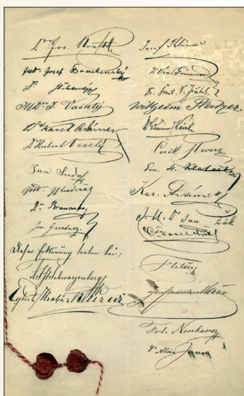
Státoprávní ohrazení při vstupu našich politiků na říšský sněm – poslanci neslevují ze svých požadavků

Určitě je třeba zmínit archivní fond „Policejní ředitelství Praha“. Ředitelství bylo v době, o které hovoříme, nejvyšším centrálním policejním úřadem v zemi. Písemnosti tohoto úřadu úzce souvisí s každodenním životem a pro badatele nabízejí