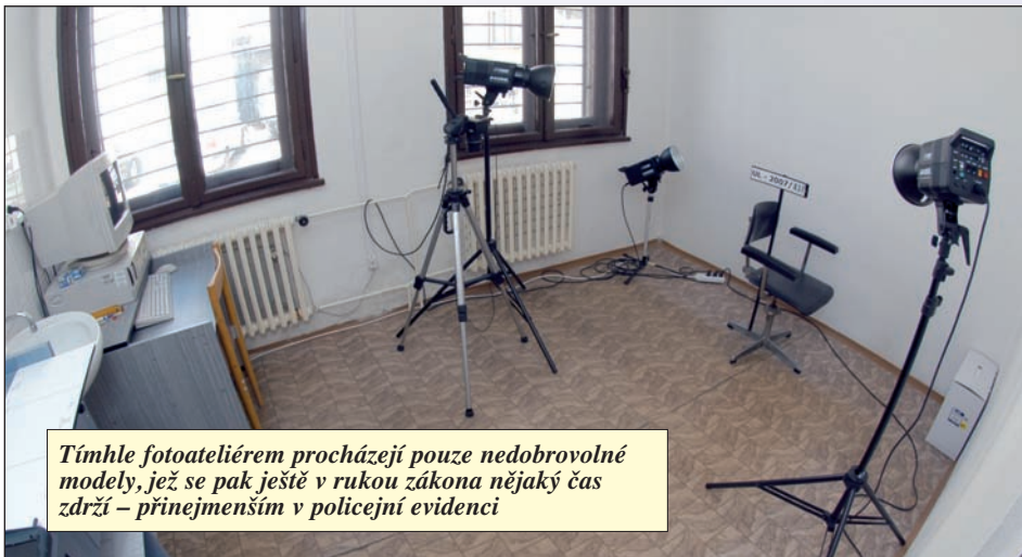
Tímhle fotoateliérem procházejí pouze nedobrovolné modely, jež se pak ještě v rukou zákona nějaký čas zdrží – přinejmenším v policejní evidenci

popis, takže jsme ho ve spolupráci s kriminálkou dostali.“