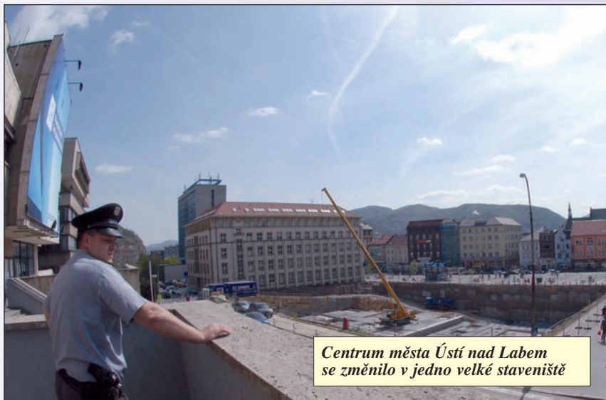
Centrum města Ústí nad Labem se změnilo v jedno velké staveniště

Obvodních oddělení mají na Ústecku tučet – tedy, včetně hlídkového a železničního. Většina je spíše pomenší, třetího a čtvrtého typu. Jen dvě mají početnější obsazení policisty, obvodní oddělení Ústí nad Labem (pořád ze zvyku postaru přezdívané OOP Město) a oddělení Severní Terasa – na největším z ústeckých sídlišť. Na území kraj-