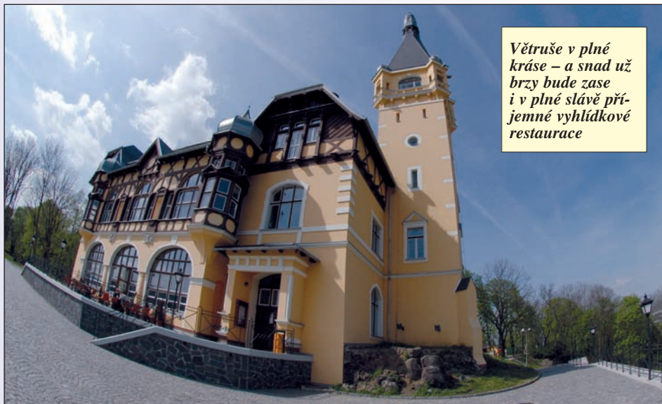
Větruše v plné kráse – a snad už brzy bude zase i v plné slávě příjemné vyhlídkové restaurace

tím šikovně zabezpečil,“ krčí nadporučík rameny. „Pro zloděje, který potřebuje svých patnáct stovek denně na drogu, je právě ta bunda lákadlo, ta se prodá raz dva! Ale notebook ukradne při té příležitosti samozřejmě taky, někde v bazaru mu ho vezmou...“