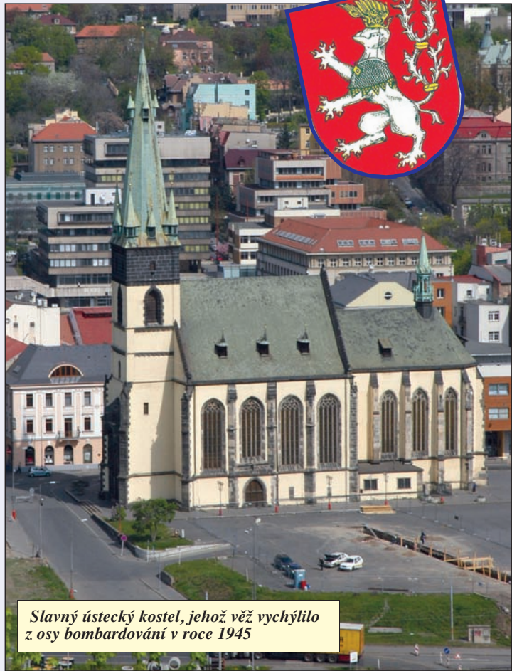
Slavný ústecký kostel, jehož věž vychýlilo z osy bombardování v roce 1945

kdy je zmíněno v zápisech pražských benedikťanů. Roku 1438, dvanáct let po slavném vítězství husitů ve velké bitvě s křižáky, se už nepíše o založení, nýbrž obnově města. Latinský název města zní hezky: Austria super Albea.