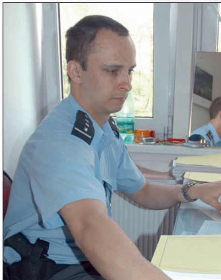
Práce policejního dozorcího je náročná na soustředění – zdánlivý poklid se během minuty může změnit v pěkný fojr

lomu patnáctého a šestnáctého století se město začalo rozrůstat – ježto se Ústečtí nezúčastnili nepodařeného povstání proti Ferdinandu I., vydělali na tom. Jenže pak přišla třicetiletá válka a podepsala se tu hodně krvavým písmem – vždyť se tudy armády převálily celkem sedmkrát!