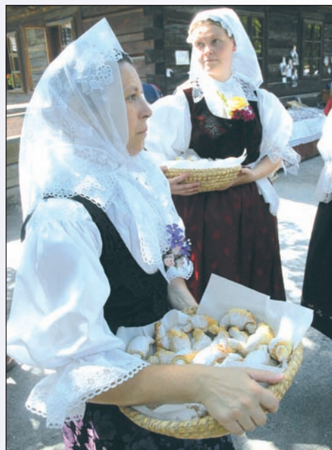
S valašskými tradicemi se setkáváte v Rožnově pod Radhoštěm tak přirozeně, jako by patřily i k dnešku

„Nedávno tady kriminální služba odhalila dva kluky, kteří vloni v Rožnově přepadáva-