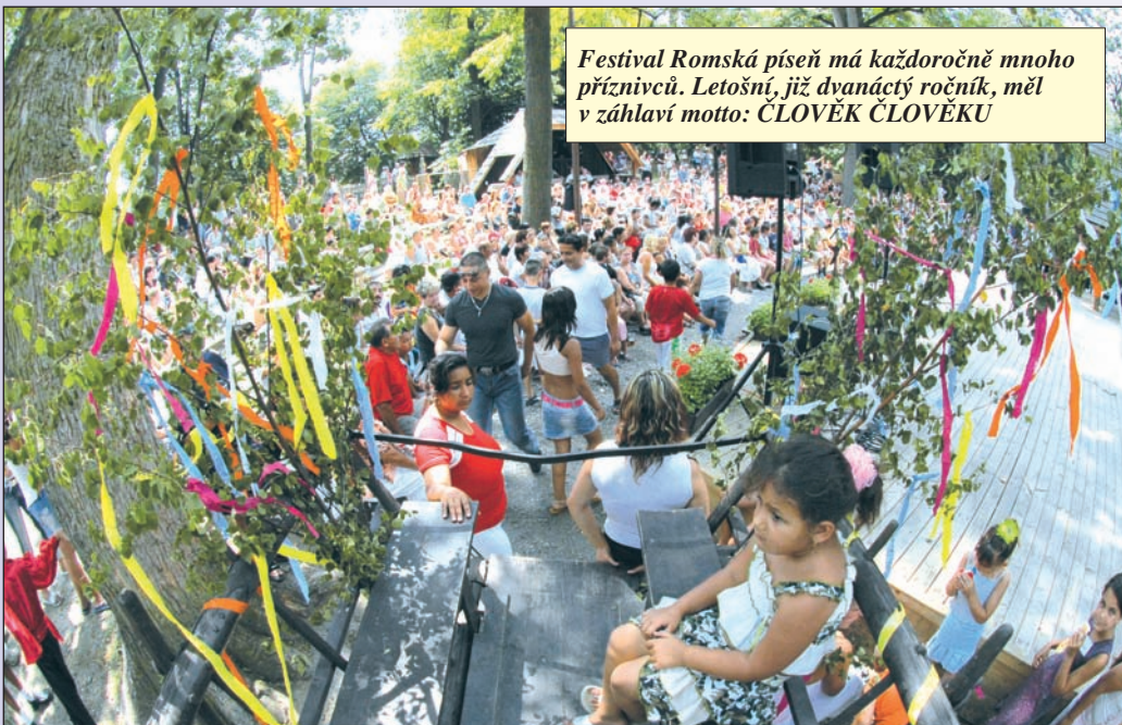
Festival Romská píseň má každoročně mnoho příznivců. Letošní, již dvanáctý ročník, měl v záhlaví motto: ČLOVĚK ČLOVĚKU