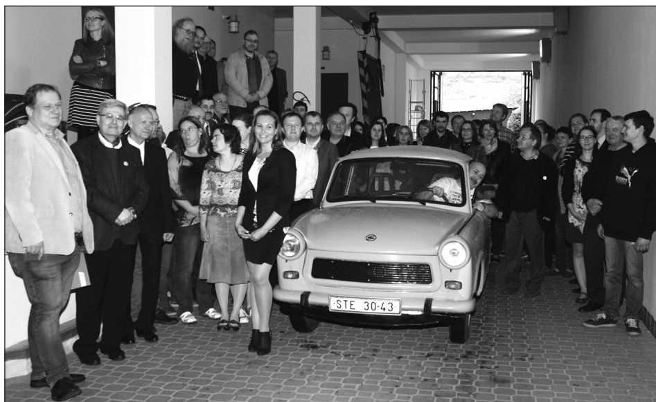
Účastníci konference Československo v letech 1986–1989 v Českých Budějovicích.