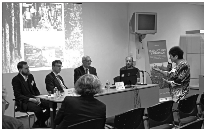
Diskuse během konference Revoluce 1989 v regionech