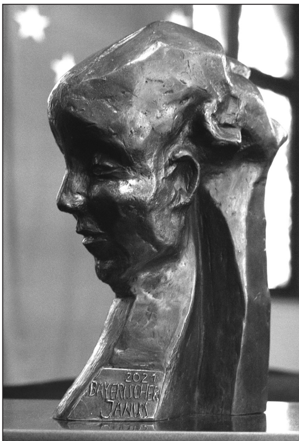
Bronzová plastika Bayerischer Janus 2021 od Moniky Jokiel

ských archivů zapojily také Fakulta aplikovaných věd Západočeské univerzity v Plzni, Friedrich-Alexander-Universität Erlangen-Nürnberg a plzeňská obecně prospěšná společnost ZIP. Projekt, který bude zakončen v srpnu 2021, je zaměřen na moderní využití historických map a plánů za pomoci nově vyvíjených nástrojů umělé inteligence.