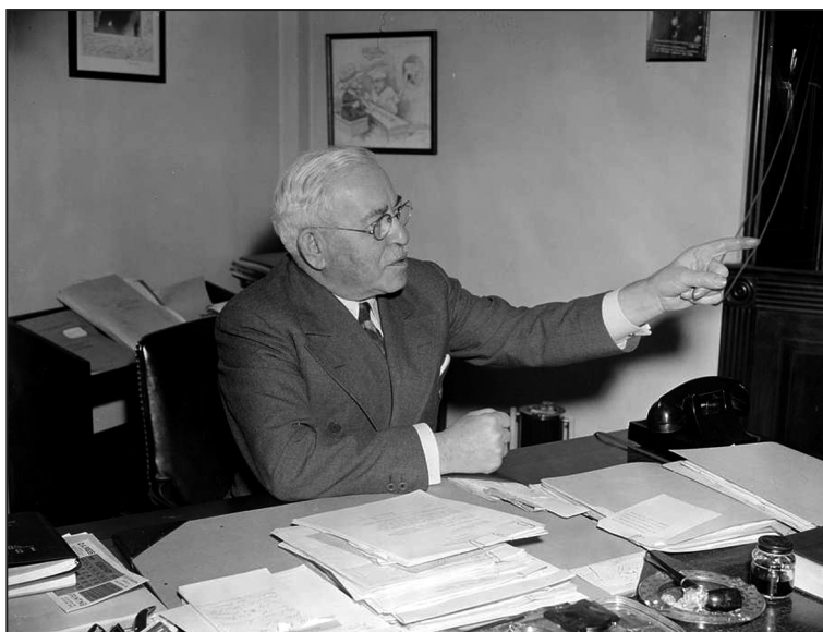
Sabath ve své kanceláři v budově Kapitolu

Roku 1906 byl za stát Illinois a Demokratickou stranu zvolen do federálního Kongresu ve Washingtonu D. C., když porazil úřadujícího kongresmana Anthony Michalka za republikány, paradoxně také Čecha. Většinu elektorátu v Sabathově 5. chicagském volebním obvodu tvořili imigranti, proto nepřekvapilo, že se v zákonodárném sboru začal věnovat přistěhovalecké legislativě. Téma mu dokázalo zajistit hladké obhájení mandátu několikrát po sobě. Nejen čeští krajané v Sabathovi viděli ochránce a vydatně pomáhali s kampaní. Během první světové války využíval svého vlivu v Kongresu k naléhání na administrativu prezidenta Wilsona, aby vyhlásila válku Rakousko-Uhersku. Představil také T. G. Masaryka, neznámého profesora odkudsi ze středu Evropy, americké smetánce a politickým špičkám. Neúnavně v Kongresu lobboval za vznik samostatného státu. Po válce byl rovněž zastáncem Společnosti národů.