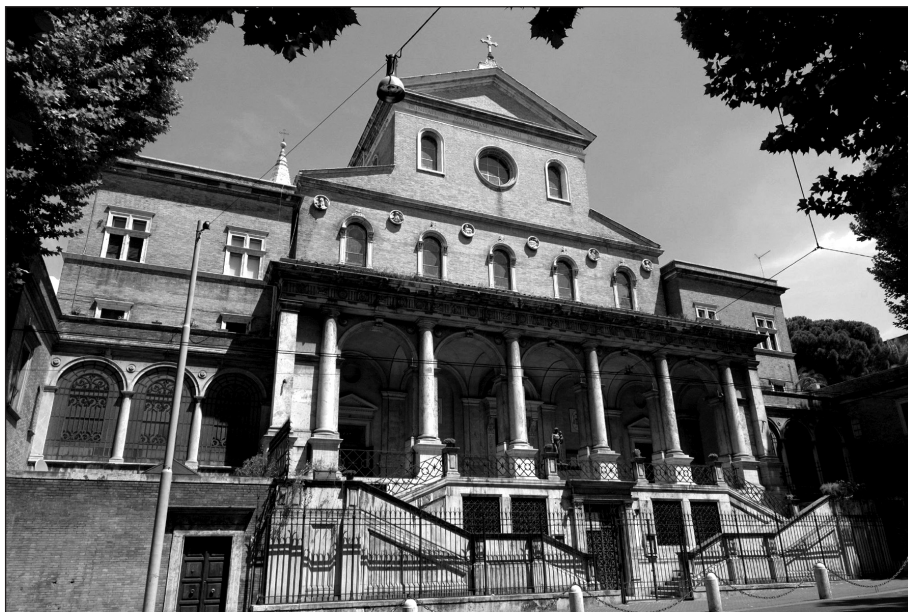
Papežská univerzita Antonianum

z roku 1947 byla vybudována jako součást Papežské univerzity Antonianum ( Pontificia Università Antonianum ). V jejím komplexu je velké auditorium pro 572 osob a 4 další velké sály, ve kterých se konference uskutečnila.