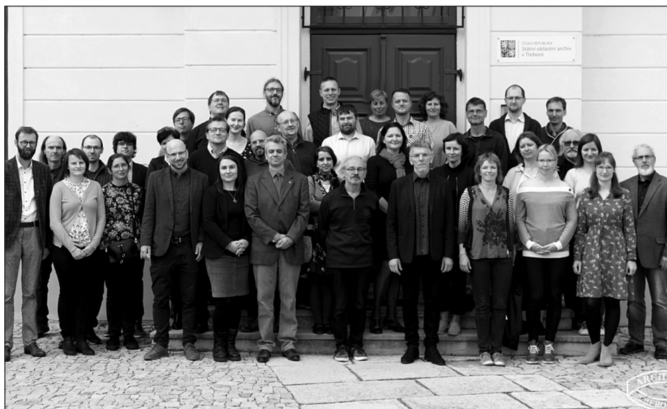
Účastníci setkání zemědělsko-lesnických a šlechtických archivářů před vstupem do archivu v Třeboni.