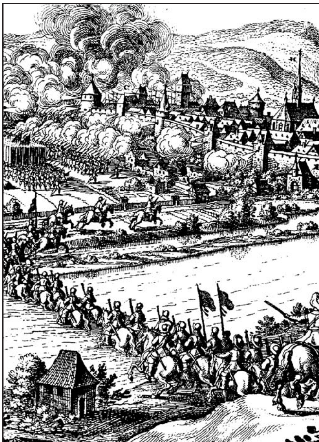
Dobývání města v čase třicetileté války

Vzrušené válečné doby jsou zachyceny v mnoha kronikách, vzpomínkách pamětníků, uměleckých dílech, ať už jsou to sochy či obrazy, a dokonce i některé prvky tehdejší módy byly ovlivněny vojenskými oděvy a výstrojí. Zajímavé dokumenty o této krušné době ovšem poskytují i mnohé archivy. Velké množství dobové korespondence z těchto časů je uloženo v Archivu ministerstva vnitra České republiky, ve fondu příznačně nazvaném Militare. Přehled tohoto obsáhlého archivního fondu zpracoval dr. Václav Líva jako tzv. regesta, tedy přehled stručných výtahů jednotlivých listin. Toto záslužné a přehledné dílo vyšlo v několika částech knižně počátkem padesátých let minulého století v nakladatelství Naše vojsko a je dodnes jedním z nejdůležitějších pramenů k vojenským dějinám našeho státu. Třetí díl těchto Regest vyšel roku 1951 a jsou v něm zahrnuty dopisy z let 1618–1625. Na straně 47 zde můžeme objevit výtah z dopisu vztahujícímu se k roku 1619, ačkoli podle některých zde uvedených okolností musel tento dopis vzniknout až na sklonku roku 1620. Ačkoli tedy dopis není datován ani podepsán, a nevíme tudíž, kdo jej psal, kdy jej psal ani komu byl vlastně adresován, přesto je pro nás