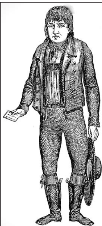
Když do tábořské kolektury vstoupil slušně oděný mladý muž, nečekala od něho kolektantka zprvu nic zlého