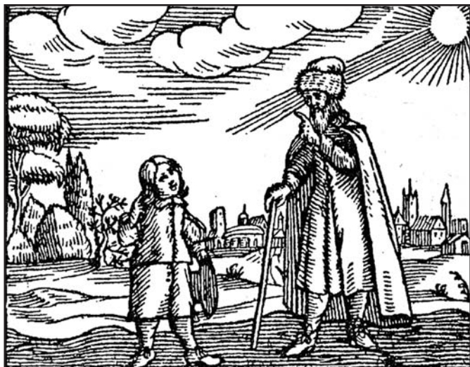
Učitel se snaží vštípit chlapci úctu a lásku ke svým bližním, V případě tábořské vraždy to však dopadlo jinak. Dřevoryt z Komenského knihy : Svět v obrazech – 1685

Není vyloučeno, že tento tragický příběh posloužil jako literární předloha spisovateli Miloši Václavu Kratochvílovi. Roku 1943 vyšly jeho Povědky lásky a smrti, z nichž jedna s názvem Balada dětská se svým námětem dost podobá našemu příběhu. Malý chlapec Jakoubek je pelhřimovskými konšely naoko obviněn z požáru města, aby tak páni radní mohli požádat císaře o náhradu škody. Té se jim dostane, ale úřady