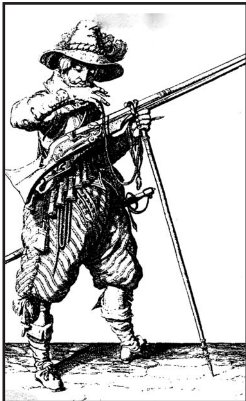
Mušketýr upevňuje pomalu hořící doutnák do čelistí kohoutku své muškety. Vojenská holandská příručka z roku 1607

neomezené důvěry svého zeměpána, jak se ostatně později ukázalo, zcela oprávněně.