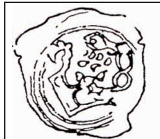
Flútek – napodobenina drobné mince z počátku 15. století