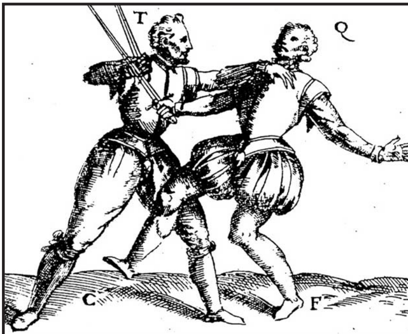
Použití záludné akce v pouliční bitce. Šermířská učebnice italského mistra Giacoma Grassiho z roku 1570

Palné zbraně byly trnem v oku všech konšelů, a tak se