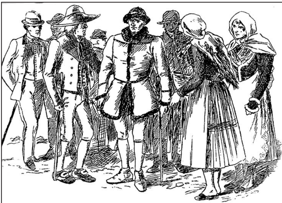
Vesničané z Písecka v kresbě M. Alše. Polovina sedmdesátých let 19. století