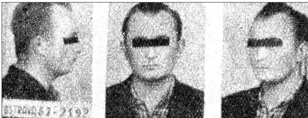
V příloze byly použity fotografie přetištěné ze soudobého tisku z autorova archivu

Dcerku, která už je vlastně slečnou, vidím pak z okénka vozu na silnici, kousek od hřbitova, kde jsem před několika hodinami potkal modlíci se krutou stařenku. Kytice rudých mečíků možná mezitím ještě znatelněji vybledla. Položila ji na hrob svého manžela žena, kterou nadosmrti poznamenala jedna jediná a nyní už dost vzdálená deštivá noc.