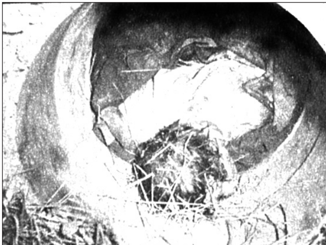
V betonové propusti přes týden leželo nehybné tělo...

obhájce vyjádřila nespokojenost nad tím, že soud „úvahu o vině zaměřil na osobu a jednání spoluobžalovaného Košáře, ale pak tyto nepříznivé úvahy vztáhl též na ni“. Pociťovala ve výši trestu zejména represivní prvek, nikoli snahu o převýchovu.