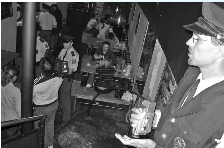
Kontroly na požití alkoholu mladistvými provádějí policisté pravidelně (dole)

a komentářů všech odborníků. Podrobnosti a výklad k zákonům byl rozdan všem účastníkům ve formě tištěného materiálu. Podrobnější shrnutí bude obsahem publikace, která se nyní na základě realizovaného semináře zpracovává.