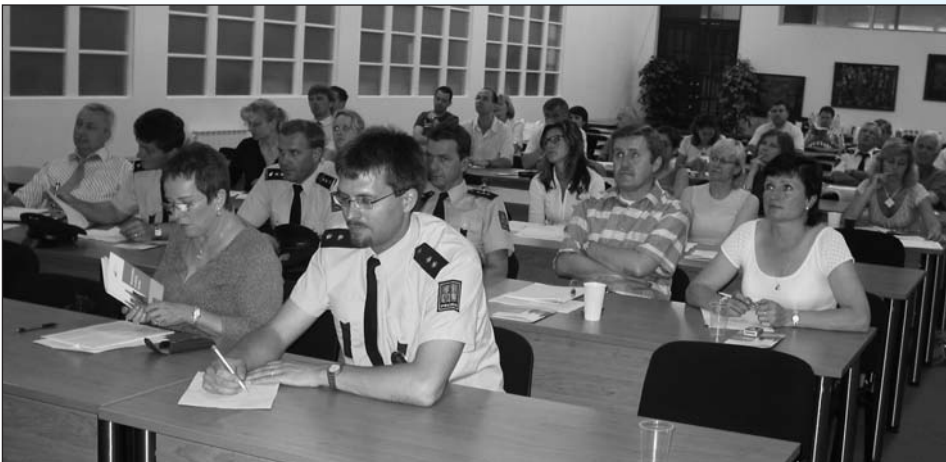
Semináře se zúčastnilo na tři desítky posluchačů, kteří se zájmem vyslechli zajímavé příspěvky