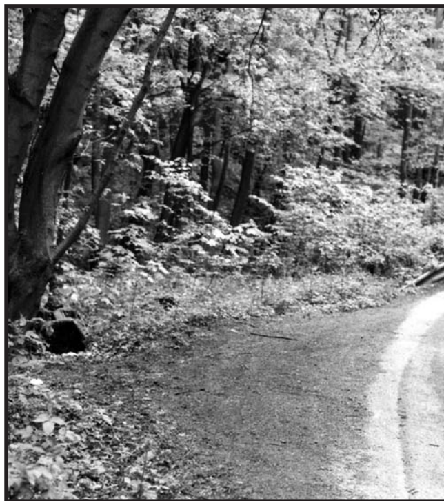
Silniční odpočívadlo, na němž zřejmě parkoval vrahův automobil

Pítva. Čtrnáct stran protokolu, spousta odborných detailů, ale nic,