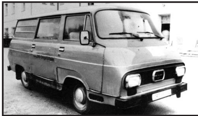
Vůz použitý k trestnému činu

Dne 6. února 1996 předstoupili před tříčlenný senát Krajského