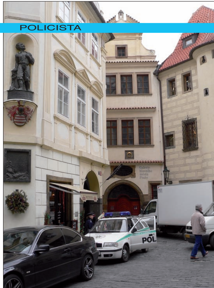
I nejmalebnější staroměstská zákoutí musí být pod stálým pozorným dohledem

Vznik velké Prahy I znamenal převelike stěhování, hejbaly se nejen škatule, ale i lidi, a ne každému to bylo vhod. Třeba lidi, co z luxusní budovy v Pelléově ulici, kde měli dva výtahy, přesídlili do Bartolomějské 6, kde není žádný, rádi nebyli. „Běhá se tam po schodech, a to je dobré pro zdraví,“ konstatuje ředitel.