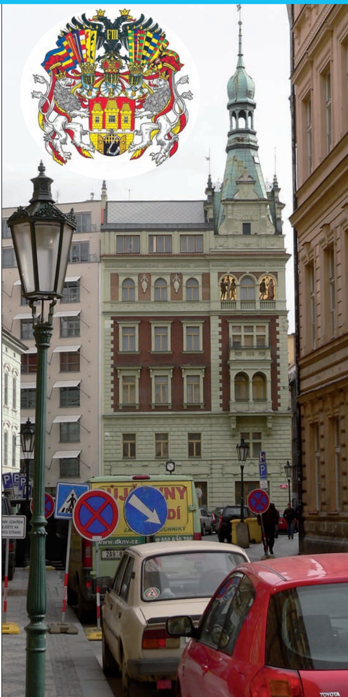
Nárožní dům na rozhraní Benediktské ulice a Rybné s Masnou