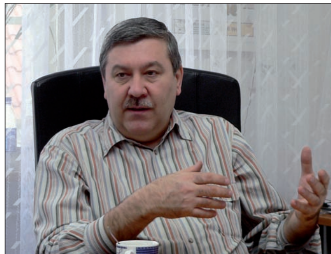
Ředitel policejního obvodu Praha I plukovník ing. Jiří Sellner

dvě stě tisíc obyvatel obvodu Praha I se ve všední den rozroste o další desetitisíce – dílem turistů, dílem přespolních tuzemců, co do hlavního města jezdí pravidelně za prací, anebo za nákupy, k lékaři, na hokej či fotbal. Udržet v ulicích pořádek a respektování zákonů je úkolem policie – a ovšem hbitě lapat ty, kdož se snad rozhodli pro opak.