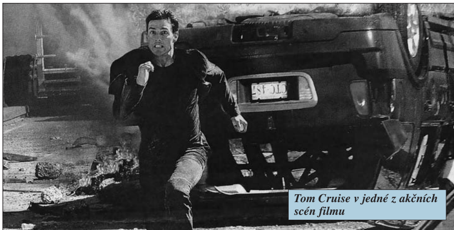
Tom Cruise v jedné z akčních scén filmu

Tajní agenti se vrací podobně jako bumerangy. A ti filmoví nepochybně vítání... Již potřetí se tak na plátně objevuje Ethan Hunt, jež někteří fanoušci považují za modernější verzi Jamese Bonda a odpůrci za trapný odvar z jmenovaného. Pravda je, jako obvykle, někde uprostřed: thriller Mission Impossible 3 je po filmářské stránce nepochybně skvěle natočený. Jenomže logika scénáře na mnoha místech skřípe a kriticky myslící divák občas nadskočí v sedadle nad dějovými schválnostmi, jež ani tak šarmanatní představitel, jakým je Tom Cruise, nestačí přehrávat.