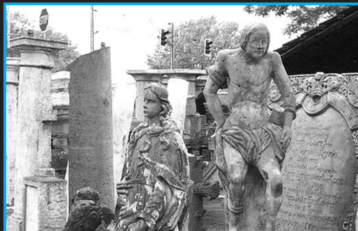
Polské kulturní památky v obchodu s antikvitami v německém Koblenzi

lo odtud dvanáct náhrobních kamenů a andělkové na zdích svatostánku už nemají hlavy. Zámek v Kameinieci navštívili během poslední války němečtí vojáci, pak ti sovětští, poté vyhořel, a jejich dílo dnes dokončují lupiči a překupníci. Kořist pašovaná do Německa je obvykle ukryta pod zeleninou nebo stavebním odpadem, riziko je minimální, rutinní kontroly po vstupu Polska do EU na hranici prakticky neexistují. A i když polští nebo němečtí celníci dostanou tip o možné zásilce, tahle hranice je dlouhá 256 kilometrů. Takže avizovaného nákladního vozu s cennými náhrobními deskami a sochami se polští kriminalisté nedočkají – projel jinudy.