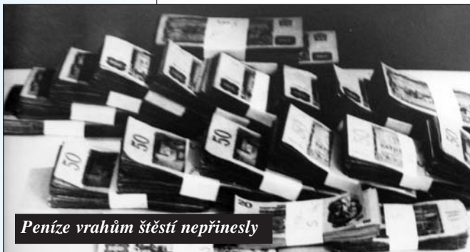
Peníze vrahům štěstí nepřinesly