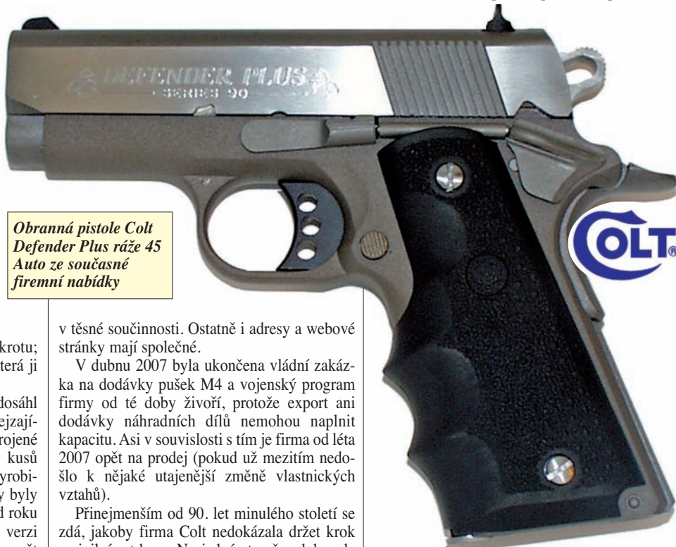
Obranná pistole Colt Defender Plus ráže 45 Auto ze současné firemní nabídky

Objem výroby už ale nikdy potom nedosáhl dřívějších rozměrů. Ekonomicky byly nejzajímavější pušky M4 a M4 A1, kterých ozbrojené síly USA požadovaly kolem 20 000 kusů ročně; celkem se jich v New Hartfordu vyrobilo asi 250 000. Ostatní vojenské zakázky byly mnohem menšího rozsahu – například od roku 1997 úpravy 60 000 pušek M16 A1 na verzi A2. Přes celkem pozitivní vývoj firma opět měnila majitele. V roce 2002 došlo k reorganizaci a vznikly dva nové subjekty: Colt Defense LLC (LLC = s. r. o.) se zaměřením na zbraně pro armádu a policii a Colt's Manufacturing Co. LLC k uspokojování požadavků civilního trhu. Oba subjekty jsou majetkem společnosti New Colt Holding a ve skutečnosti operují