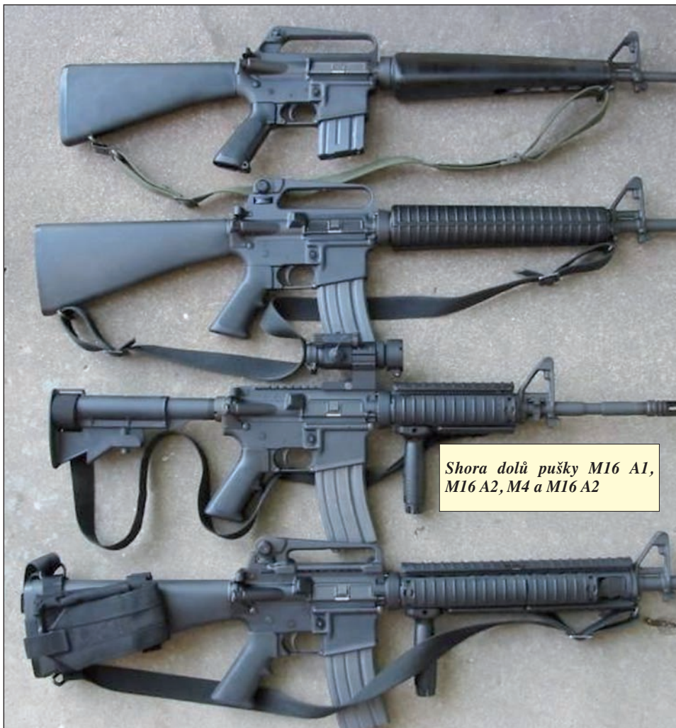
Shora dolů pušky M16 A1, M16 A2, M4 a M16 A2

statný díl z celkové dosavadní osmimiliónové produkce.