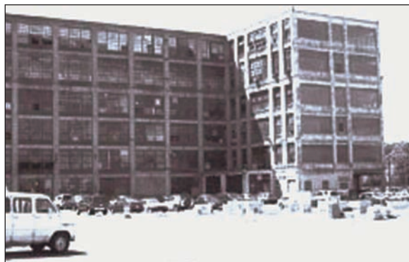
Budovu z roku 1919 čeká demolice. Na původním místě legendární zbrojovky vznikne národní park Coltvil.

Přinejmenším od 90. let minulého století se zdá, jakoby firma Colt nedokázala držet krok s civilním trhem. Na jedné straně redukovala výrobní sortiment, aniž by ho na druhé straně dokázala doplňovat prodejně zajímavými produkty – vezměme si například na přelomu tisíciletí obchodně zcela neúspěšné epizody s „revolučními“ pistolemi Colt All American 2000 nebo s pistolemi Colt Z40 (tato druhá, celkem zajímavá konstrukce vznikla jako pro-