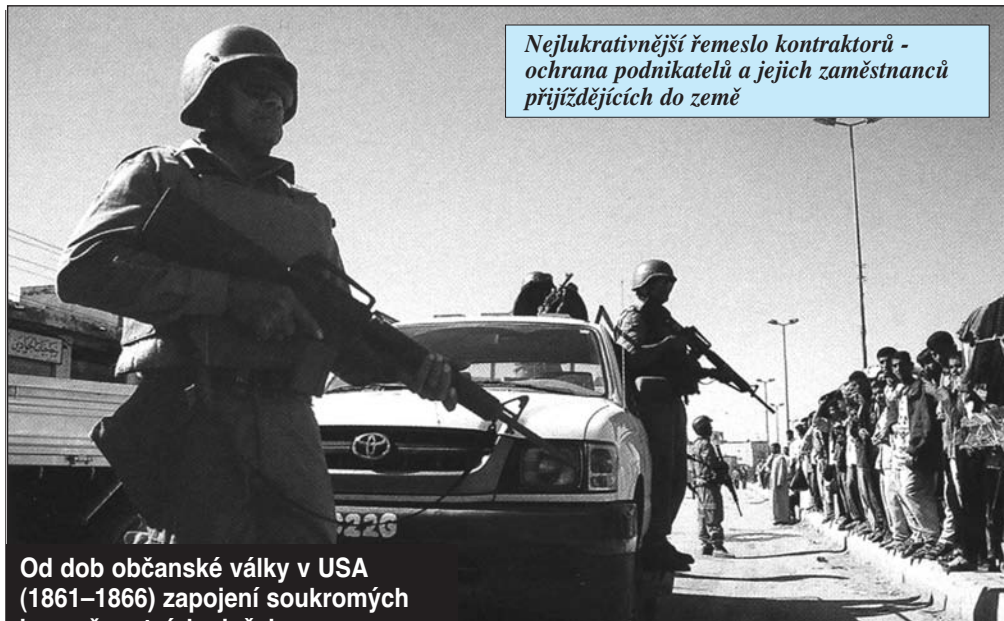
Nejlukrativnější řemeslo kontraktorů - ochrana podnikatelů a jejich zaměstnanců přijíždějících do země

Od dob občanské války v USA (1861–1866) zapojení soukromých bezpečnostních služeb do válečných akcí nikdy nedosáhlo takových rozměrů, jak je tomu od 90. let 20. století. Opět je tu výrazný americký prvek, i když se jedná o střetnutí na druhém konci zeměkoule. A příznačné je, že najímání a aktivitám těchto novodobých žoldnéřů věnuje pozornost především americký tisk, zatímco ve většině ostatních zemí včetně ČR se o nich nedozvíme téměř nic.