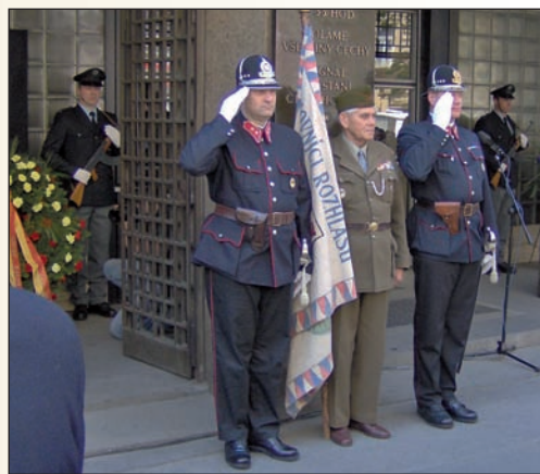
Jeden z pamětníků boje o Československý rozhlas společně s hlídkou Četnické pátrací stanice Praha stojí čestnou stráž u památníku před rozhlasem

Klub má za sebou několik úspěšných a zajímavých akcí. Například Rozhlas 2005 byla akce doslova unikátní. Byla to rekonstrukce z období Pražského povstání, obsazení Československého rozhlasu. Akce pro-