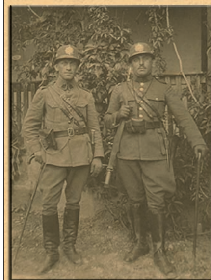
četnická hlídka 1935