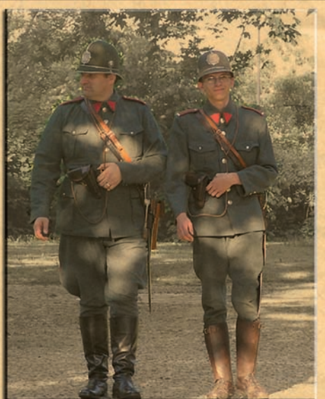
četnická hlídka 2005

policie k osvobození, o kterém se dosud moc nemluví.