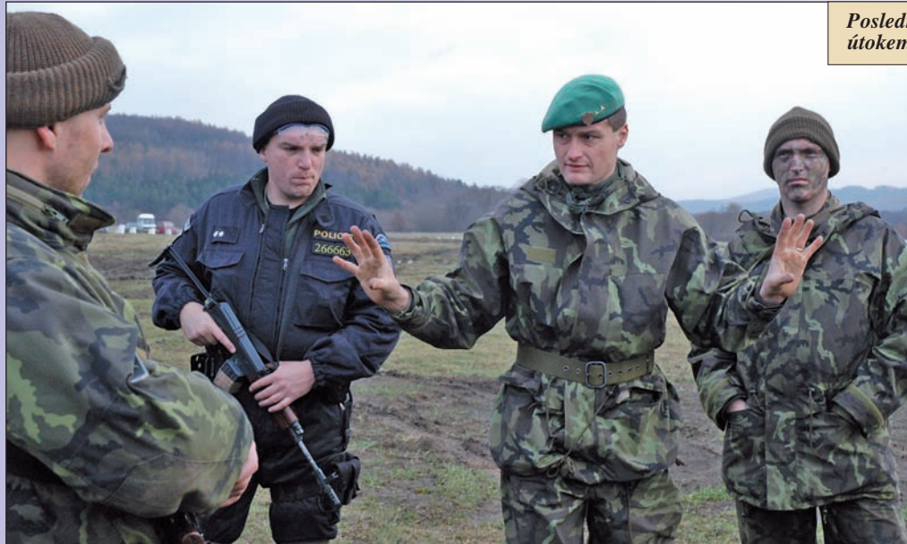
Poslední instrukce před opakovaným útokem

místě se neshlukuje příliš mnoho lidí, všichni jsou neustále v pohybu. Podvědomě automaticky registruje fakta. Zeď je klasická, cihlová. To je důležité. Sádronová příčka například nikoho před střelbou neochrání. Výklenek zasahující do schodiště. Nebezpečné místo, v němž by se snadno mohl někdo skrývat. Dvě hlavě kryjí kolegu, který opatrně postupuje dopředu. Gesto naznačuje, že je všechno v pořádku, ve výklenku nikdo není.