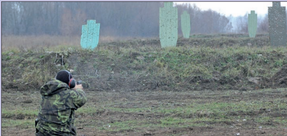
Figury padaly jako kuželky