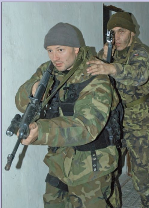
Útočící dvojice se navzájem zajišťují

lo zneškodnit palebné hnízdo útokem. Čtyři muži vyrazili na zteč. Zarachotily výstřely.