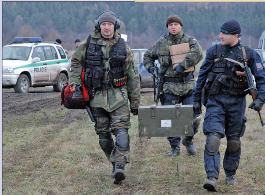
Odtroubeno, konec. I střelnice se však musí uklidit

Muži z jednotky se okamžitě kryjí, velitel se snaží bleskurychle vyhodnotit situaci. Směr střelby, počet útočníků. Dávka se opakuje, pod střechou starého mlýna se objevují záblesky. Povely nahrazují gesta. Vojáci a policisté obkličují nebezpečné stavení, ať už je uvnitř kdokoli, možnost jeho úniku je nulová.