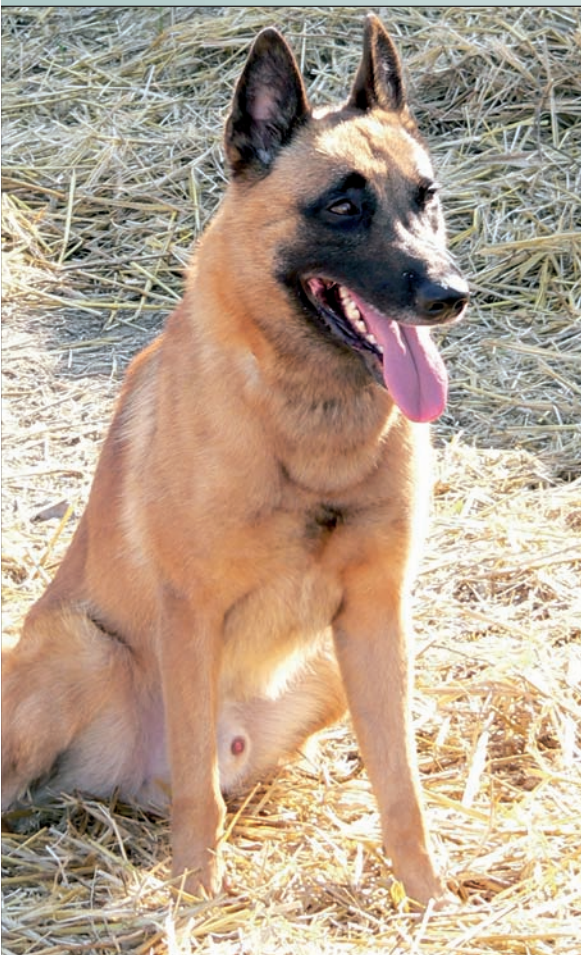
Soutěžení skončilo, přišel čas odpočinku

blížícím se podzimem. Psi se věnovali odpočinku, jejich pánové se shlukli před nástěnkou, kde se každou chvíli měly objevit celkové výsledky.