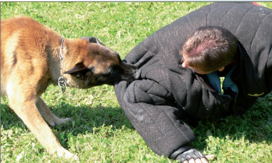
Německý ovčák ochotně pózoval v potřebných detailech

jen přečíst na starých výsledkových listinách. Denny, Cerro, Arzo, Bak a Orest ..