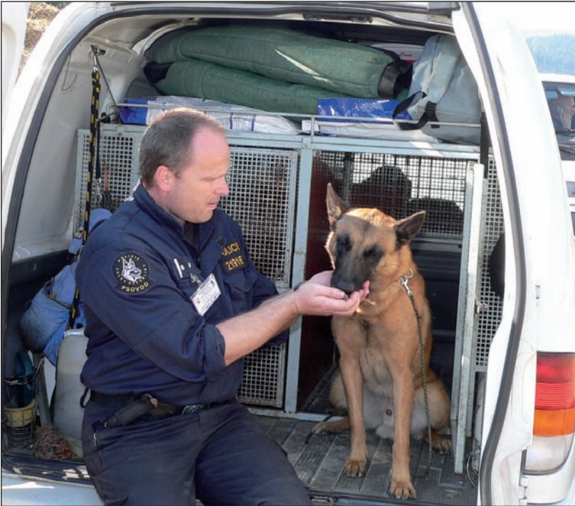
Žízeň v polních podmínkách