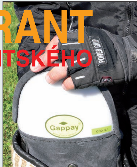
Figurantské pomůcky se v posledních letech výrazně zlepšily

Na malebném místě uprostřed lesů kdysi stávala vesnice, ve válečných a poválečných časech byla vykliděna, později zde vyrostl areál velké školy v přírodě, kam se sjížděly děti ze zakouřeného Mostu. To však netrvalo dlouho, z nedostatku peněz na provoz byla ozdravovna uzavřena, na nějaký čas tu našla sídlo střední policejní