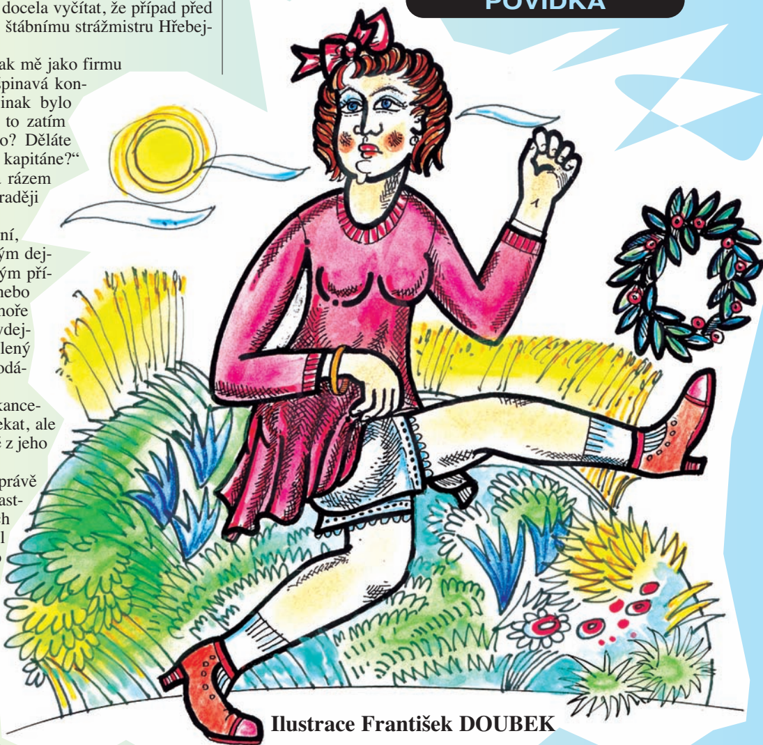
Ilustrace František DOUBEK

přece lejou i barevný kovy. A je to vlastně taky přes koleje. Že mě to nenapadlo. Toho chlapíka, co byl u Studánky, znáte?“