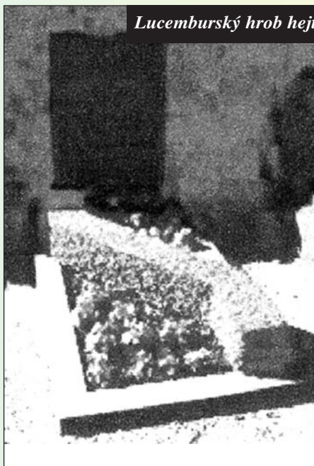
Lucemburský hrob hejtmána z Kopníku

telefonů. A co ještě horšího: přistihla manžela, jak na internetu flirtuje s nějakou konkurentkou. A tak došlo na pěsti a k rozluce, pak znovu na usmíření atd.