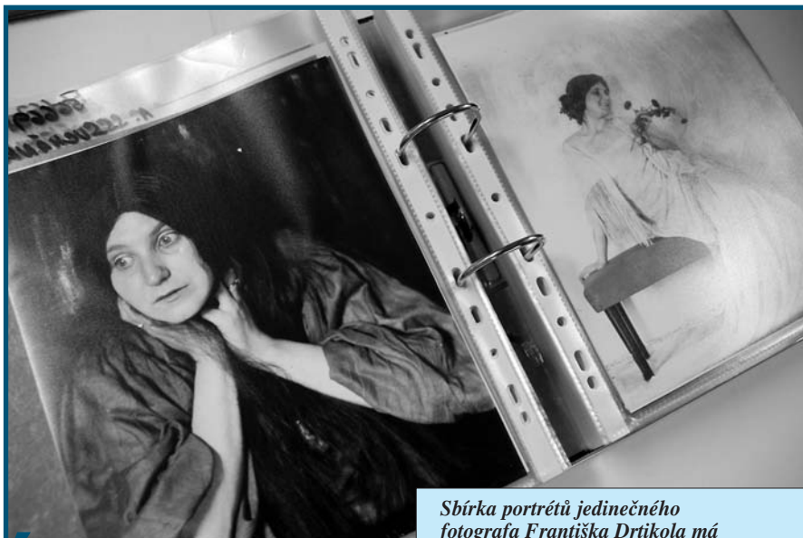
Sbírka portrétů jedinečného fotografa Františka Drtikola má nezaměnitelný „rukopis“