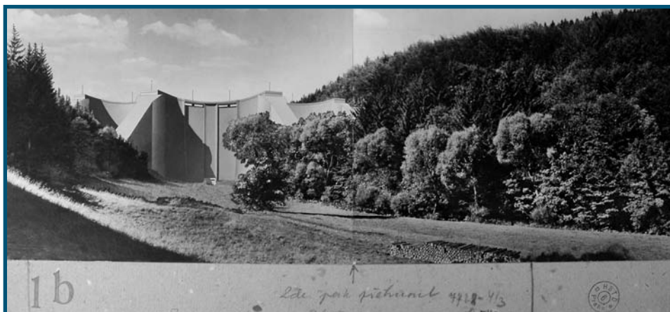
Projekt budoucí přehrady zasazený pomocí fotografie do reálné krajiny ukáže, jak v případě jeho realizace změní vytypované místo svou tvář

lo. Historický význam fotografie je, jak vidíte, mnohem větší, než se u nás traduje.