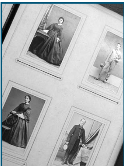
Rodinná alba patří mezi nejkrásnější sbírkové fotodokumenty

Které nově připravované projekty zaměst-