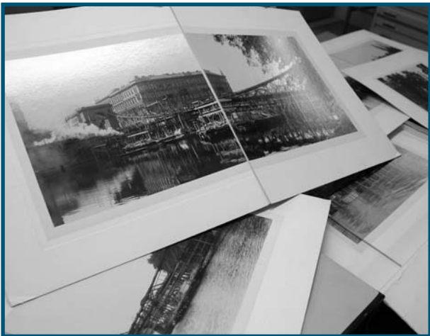
Unikátní dokumentace ke stavbě mostu císaře Františka v Praze