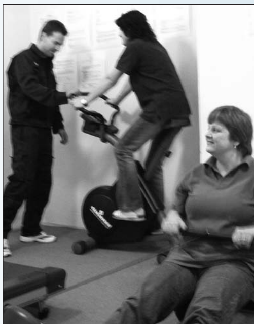
Obdobně jako dobrovolný pobyt v mučírně zvané posilovna – sluší stejnou měrou dámám jako pánům...

sbor i ostatní zaměstnanci školy spoustu úkolů – zejména proto, že víme zcela jasně, že nám přibude jen práce, že nám nikdo nepřidá ani peníze, ani tabulková místa pro nové lidi. Ale navzdory tomu považujeme své nové pověření za velikou čest a na tu práci, jež nás očekává, se těšíme.“