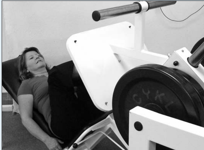
Trápení vlastního těla může mít i podobu velice příjemnou...

sbor i ostatní zaměstnanci školy spoustu úkolů – zejména proto, že víme zcela jasně, že nám přibude jen práce, že nám nikdo nepřidá ani peníze, ani tabulková místa pro nové lidi. Ale navzdory tomu považujeme své nové pověření za velikou čest a na tu práci, jež nás očekává, se těšíme.“