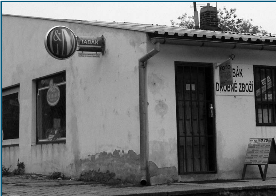
...stejně jako chýnovský stánek s cigaretami. Mimochodem, cigarety byly pro libčické zloděje zvláště oblíbený artikl!