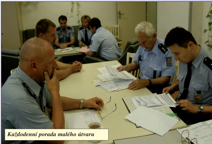
Každodenní porada malého útvaru

Kriminalitu mají v horské kulise ochránci zákona a pořádku obdobnou jako kdekoli jinde v republice. Méně je pravděpodobné vloupání do aut, protože to většinou provádějí cestáři. A vzhledem k tomu, že rajon