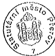
Ing. Jiri Lajtoch primátor města Přerova

Zastupitelstvo města Přerova po projednání schvaluje vydat Obecně závaznou vyhlášku č. ..../2010, kterou se mění Obecně závazná vyhláška č. 5/2008 o trvalém označování psů ve znění uvedeném v příloze č. 1.