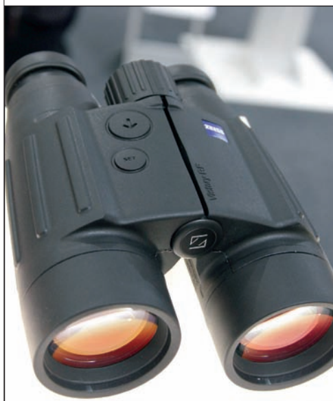
Binokulár Zeiss Victory RF s laserovým zaměřovačem a zabudovaným balistickým počítačem