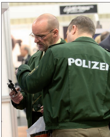
Veletrh IWA navštěvuje rok od roku stále víc policistů a vystavovatelé tomu přizpů- sobují nabídku

jsou Zeiss Victory RF plnohodnotné dalekohledy, nemusíte tedy k dálkoměru nosit ještě navíc pozorovací dalekohled nebo naopak. Všechno je v jednom balíčku, kupodivu nijak těžkém, kompaktním, s poměrně jednoduchým ovládáním.